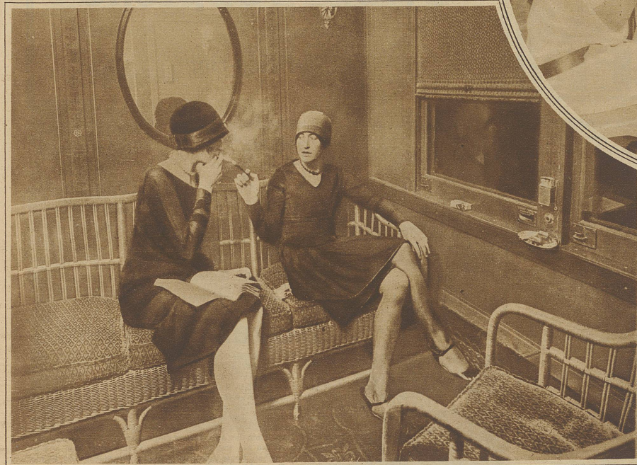
Im Damen-Rauchabteil Die Pennsylvania Eisenbahngesellschaft hat auf der Strecke Philadelphia-New York Rauchabteile für Damen eingerichtet. Ein Blick in das erste auf der Fahrt befindliche Abteil.

den Tanz. Tanz, ein ethisches Problem für die Frau! Durch ihn soll der Leib zum Ichausdruck werden. Die Seele soll in den Körper dringen, sich ihm zum Instrument unterwerfen. Wie dann dieses „Ich“ zum Seelenbrand, zu stärkster Aktivität auflodert, das zeigen uns große Tänzerinnen wie die Wigmann.