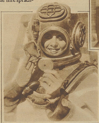
Die Tiefsee-Taucherin, ein neuer Frauenberuf In Californien soll sich eine Anzahl Damen der Gesellschaft zu Taucherinnen haben ausbilden lassen. Zweck des Berufes soll sein, sich in den Dienst der Tiefseeforschung zu stellen. Daß das Ganze mehr eine Laune als ernster Broterwerb ist, verraten der Blick in den Spiegel und die Bereitschaft der Puderquaste, bevor am Taucherhut das Visier heruntergelassen wird.

Der außerordentliche Schaffensdrang dieser Frau hat