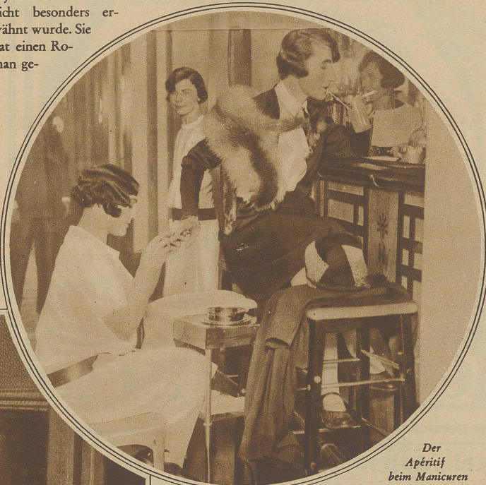
Der Apéritif beim Manicuren