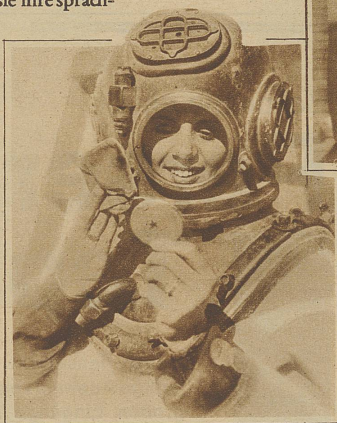
Die Tiefsee-Taucherin, ein neuer Frauenberuf In Californien soll sich eine Anzahl Damen der Gesellschaft zu Taucherinnen haben ausbilden lassen. Zweck des Berufes soll sein, sich in den Dienst der Tiefseeforschung zu stellen. Daß das Ganze mehr eine Laune als ernstes Broterwerb ist, verraten der Blick in den Spiegel und die Bereitschaft der Puderquaste, bevor am Taucherhut das Visier heruntergelassen wird.

Der außerordentliche Schaffensdrang dieser Frau hat