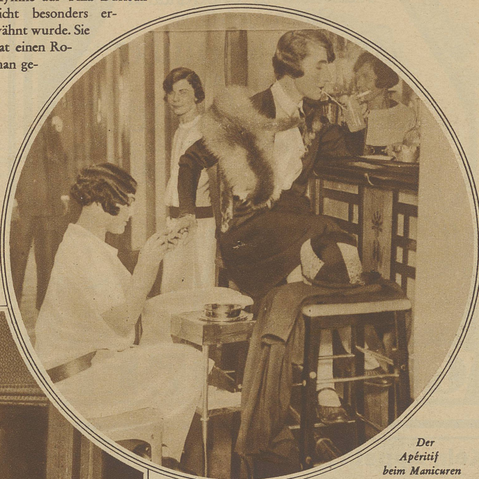
Der Apéritif beim Manicuren