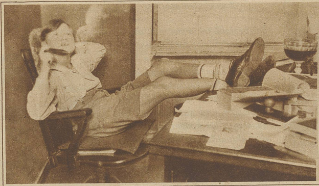
Der hoffnungsvolle Stammhalter in Abwesenheit seiner lieben Eltern ...

sten Liqueurs in der einen, die Zeitung in der andern Hand und aus seinem Haar quoll ein Odeur, der zum Verwechseln nach Ihrer Pomade roch. Auf dem Küchentisch hatte die Köchin nach der Art regelrechter Wahrsagerinnen die Karten ausgebreitet. Den Finger auf den Coeur-Buben gelegt, sagte Sie mit einem verschmitzten Blick auf das reizende Stubenmädchen: «Ihnen wird der Alte ein prächtiges Reise-geschenk mitbringen.» (Verzeihen Sie wieder die unverschönerte Mitteilung.) Ein Geklapper und Geplapper, das gar nichts mit dem Geratter der Schreibmaschine zu tun hatte, drang aus dem Büro und als ich suchte die Tür öffnete, sah ich, daß jede ihrer Sekretärinnen noch einen männlichen Helfer