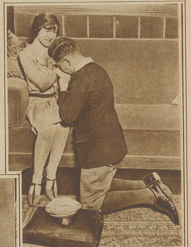
Auch Paulinchen, die Tochter, ist nicht ganz ohne Beschäftigung

zugezogen hatte, aber allem Anscheine nach nicht etwa zum Zwecke rascheren Arbeitens. Bei Bowle und Konfekt wurden tolle Streiche gespielt und lose Reden geführt. Immerhin muß