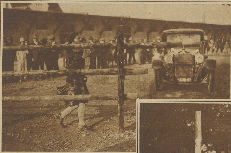
Die Konkurrenten haben vor eine Barriere zu fahren, sie zu öffnen, durchzufahren und sie wieder zu schließen