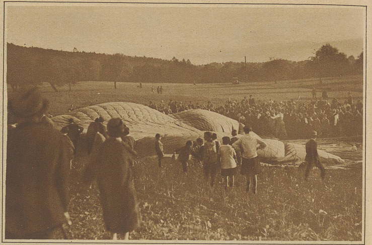
Die «Thuna» landete oberhalb Zollikon