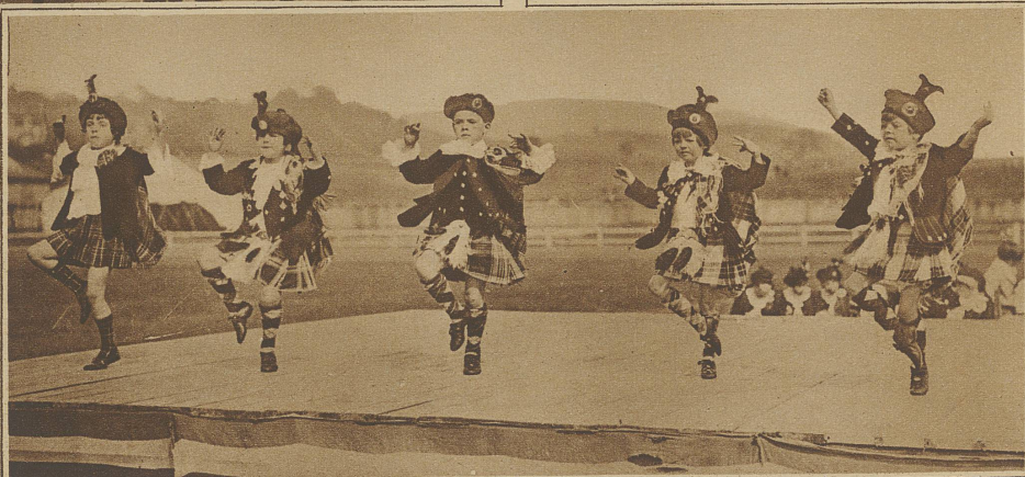
Kleine Schotländer führen einen Nationaltanz vor, der sehr gut als gymnastische Uebung gelten könnte, wenn die Kinder anstatt mit der zwar malerischen, aber etwas schwerfälligen Hochländertracht, mit dem Turnhemd bekleidet wären

eine andere Logik, sie ist logisch auf ihre Art. Nur ist ihre Logik zuweilen mehr Folge ihrer Laune und geistigen Sprunghaftigkeit, als Folge des Nachdenkens oder einer wirklichen Meinung. *