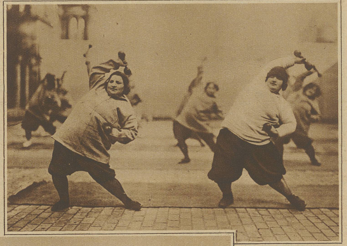
Auch diese weibl. «Frachtkolli» möchten schlanker und wieder etwas beweglicher werden

Man wirft der Frau häufig vor, sie sei unlogisch. Die Frau hat nur