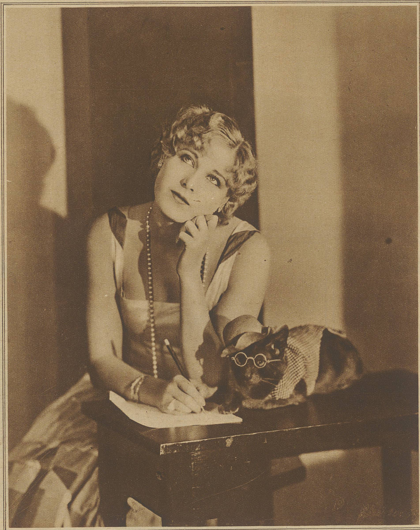
Soll ich?... Soll ich nicht?

«Ich glaube nicht! Er wird eher sterben als verraten...»