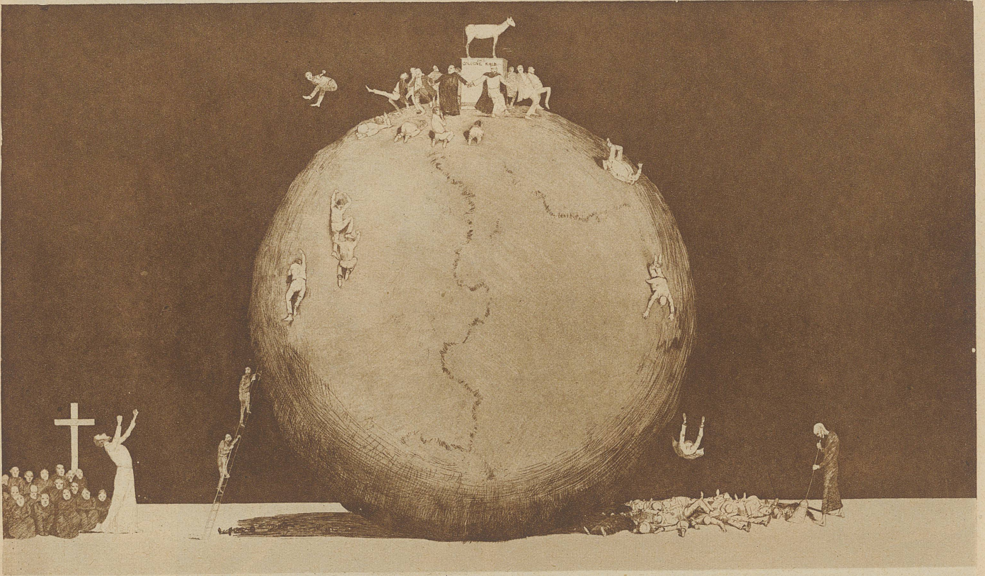
RADIERUNG VON JOSEPH UHL