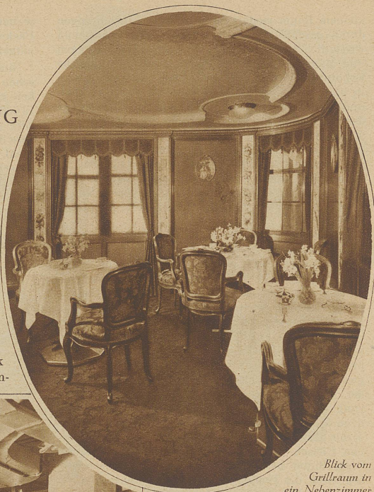
Blick vom Grillraum in ein Nebenzimmer der «New York»

gelüste abgewöhnt und seinen uralten Groll auf bestimmte Jahreszeiten und Zonen verlegt (was unliebsame Ausnahmen nicht ausschließt). / Im allgemeinen entwickelt alles regsten Appetit, wozu der wohl allen Menschenkindern innewohnende Egoismus verführt, der allen einflüstert: es kostet nichts — weil man alles vorausbezahlt, kommt es einem so gratis vor! — und nimm, was du bekommst. Iß dich krank und die Gesellschaft pleite! So eine Gelegen-