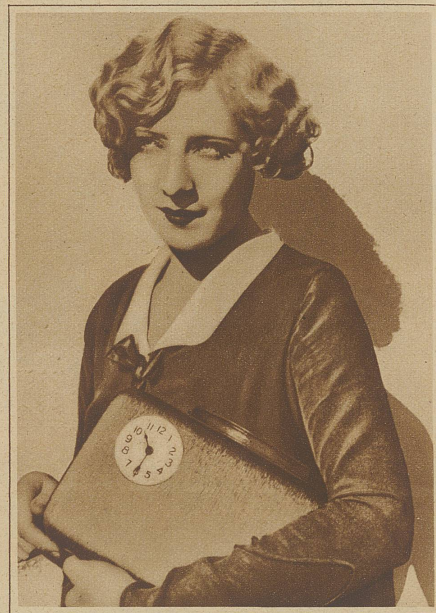
Ob er versteht, was die Uhr geschlagen hat?

entsprechende Quantum Lux in sehr heißem Wasser aufzulösen; kaltes Wasser beizufügen bis die Lösung lauwarm ist und diese dann zu Schaum zu schlagen. Das Kleidungsstück wird gereinigt durch wiederholtes Eintauchen und indem an