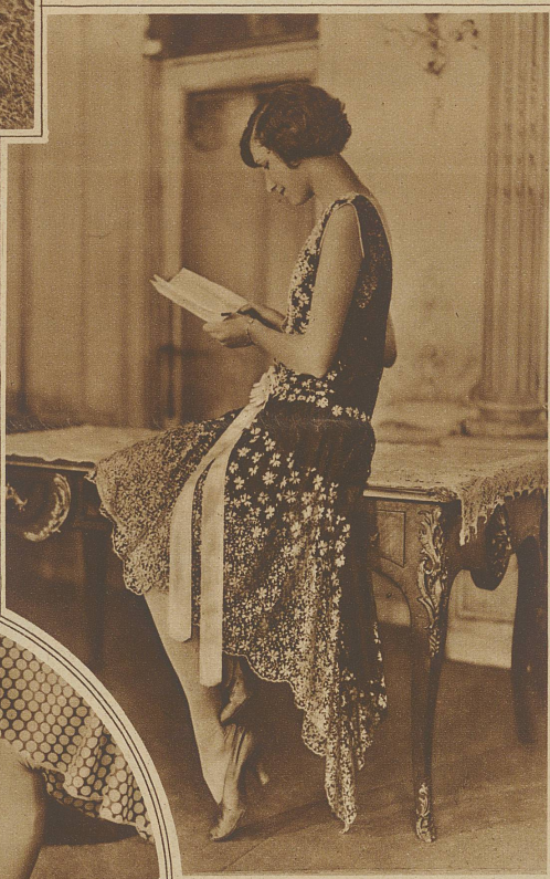
Auch die moderne Frau hat Sinn für Poesie. Sie trägt ein entzückendes Spitzenkleid, dessen «Mahlchen» auf schwarzem Grund mit rosa Rand erblühen. Das Dokument, das sie nachdachtsvoll studiert, dürfte eher als die Schneiderinnenrechnung . . . die eigene Verlobungsanzeige sein

besonders schmutzigen Stellen der Schaum mehrmals durch das Gewebe hindurchgedrückt wird. Dreimal in lauwarmem Wasser spülen. Das Wäschestück keinesfalls im Wasser liegen lassen, sondern dasselbe ständig durch das Wasser ziehen, damit allfällig abblutender Farbstoff sich nirgends festsetzen kann. Das Wasser ausdrücken; nicht winden! Das Stück in ein reines Tuch einrollen und es dann im Schatten ausbreiten. Bevor es ganz trocken ist, muß es in die richtige Form gezogen werden; aber man soll Kunstseide nie aufhängen, da sie sich durch das Eigengewicht verziehen könnte. Unter Benutzung eines trockenen Tuches auf der linken Seite mit einem warmen Eisen bügeln; aber nie sehr heiß bügeln. + Für farbige Seidensachen sollen Seifenlösung und Spülwasser kaum lauwarm sein und es soll sehr rasch gewaschen werden. Bei dieser Methode werden Fixiersubstanzen wie Essig, Salz, Alaun überflüssig.