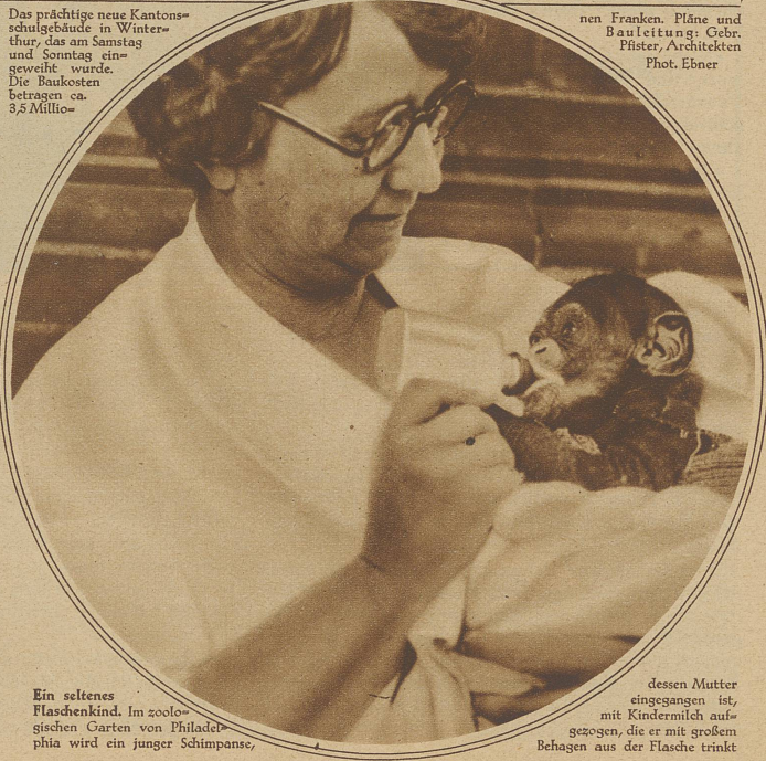
Ein seltenes Flaschenkind. Im zoologischen Garten von Philadelphia wird ein junger Schimpanse,