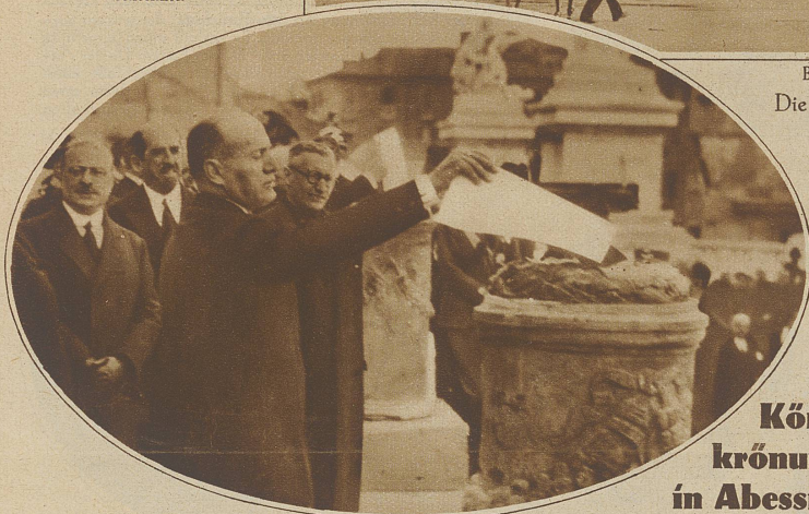
Der Duce übergibt die Titel den Flammen