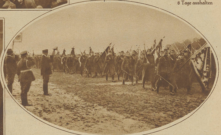
Vorbeimarsch der in Prag in Garnison liegenden Truppen vor Präsident Masaryk anlässlich der Unabhängigkeitsfeier