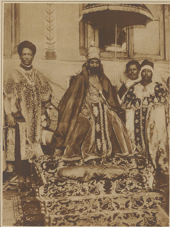
Ras Tafari nach der Krönung

Ras Tafari, der bisherige Regent von Abessinien, hat trotz der Widerstände der Kaiserin Judith, einer Tochter Meneliks II., die Macht an sich gerissen und sich zum König ausrufen lassen. Er erreichte sogar, daß die Kaiserin selber ihm die Königskrone, deren Wert auf 2,5 Mill. Fr. geschätzt wird, aufs Haupt setzen mußte