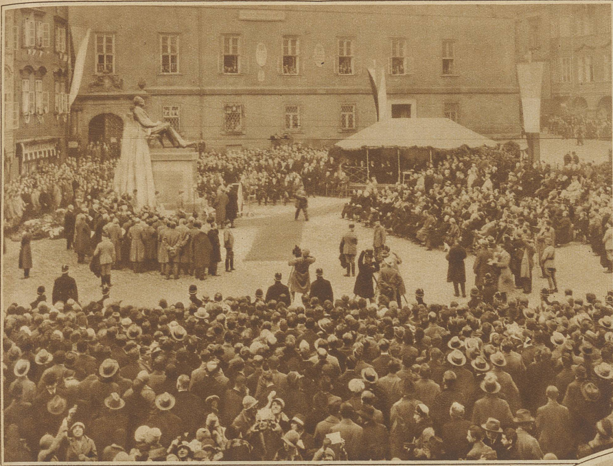
Einweihung des Denkmals für den französischen Historiker ERNEST DENIS in Prag, der als einer der eifrigsten Förderer der Unabhängigkeit der Tschechoslowakei gefeiert wird