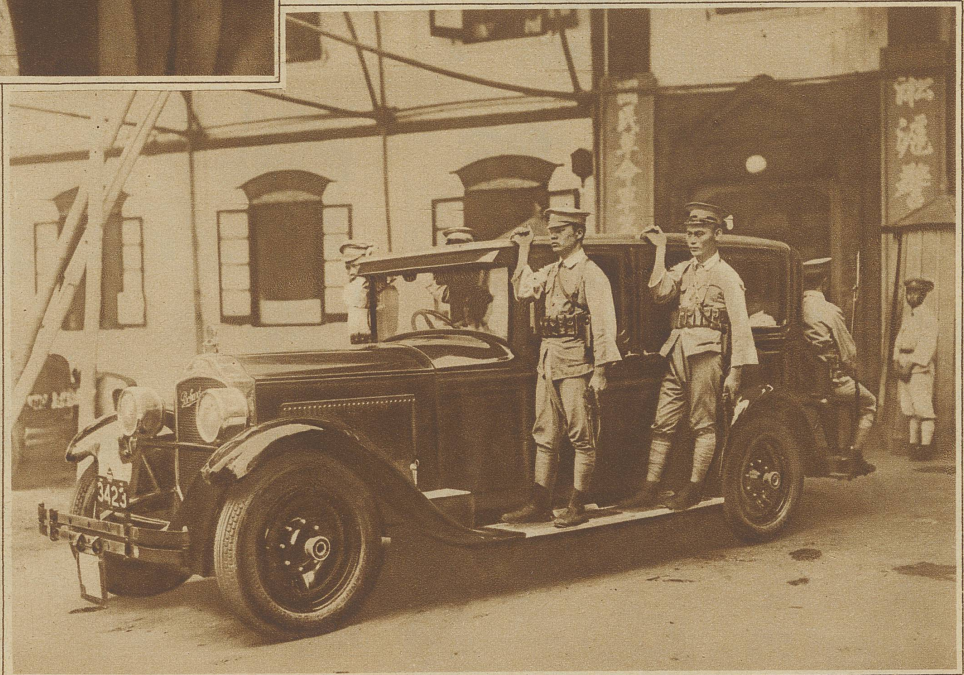
In China an der Spitze der Regierung zu stehen, gehört offenbar nicht zu den Annehmlichkeiten des Lebens. So hat der General der nationalistischen Armee, Chang-Kai-Shek, sich ein Auto bauen lassen, das hinten zwei Sitze für bewaffnete Begleiter hat. Außerdem sind an den Seiten Handgriffe angebracht, damit auch auf den Trittbrettern je 2 Soldaten stehen und ihn auf der Fahrt begleiten können