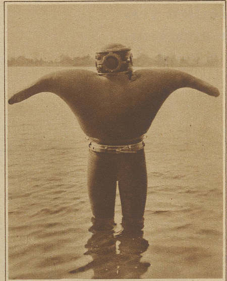
Ein neuer Rettungsanzug für Schiffbrüchige, der wie ein vorsintflutliches Seeungeheuer anmutet. Er enthält innen luftgefüllte Zellen, die den Schiffbrüchigen über Wasser halten. Da der Anzug auch Lebensmittel faßt, kann man es darin etwa 8 Tage aushalten