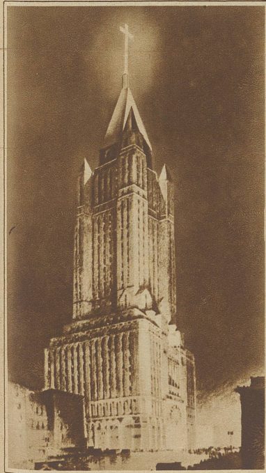
Ein neues Wahrzeichen New Yorks. Auf der Turmspitze der Wolkenkratzerkirche des «Broadway Temple» in New York ist unter dem Namen «The Commander Byrd Aerial Beacon» ein riesiges Lichtkreuz errichtet worden, das 75 Fuß hoch und 37 Fuß breit ist, eine Stärke von 500 Millionen Kerzen entwickelt und für Flieger bis auf 100 Meilen Entfernung sichtbar ist