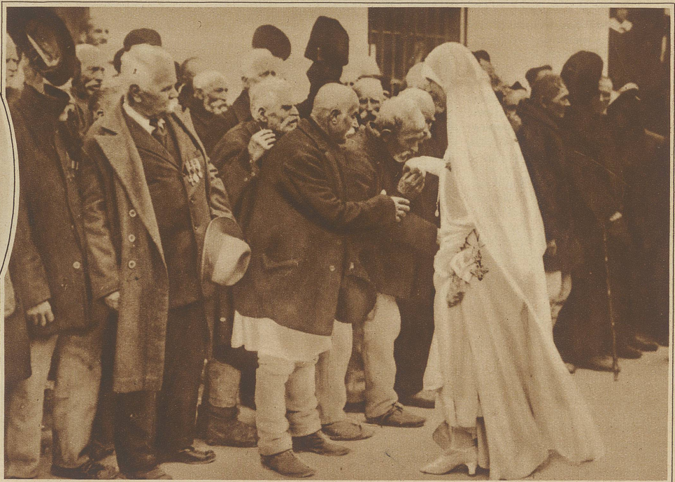
Rechts: Königin Marie begrüßt die an der Jubiläumsfeier teilnehmenden Veteranen