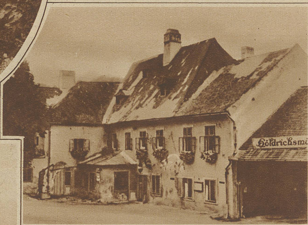
Die Höldrichsmühle in Mödling bei Wien, wo Schubert sein berühmtes Lied «Am Brunnen vor dem Tore» komponierte

der hat's vom lieben Gott.» Drei Jahre verbringt er als Hilfslehrer