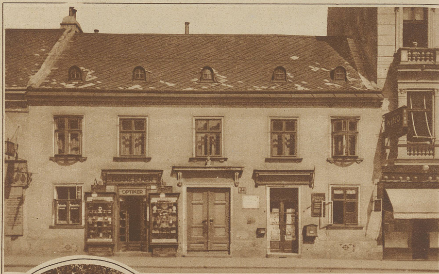
Schuberts Geburtshaus in Wien