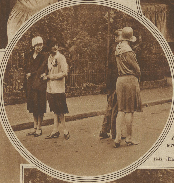
Links: «Das soll ihr Vetter sein?»

haben, daß sie bei Miteinanderarbeit in Geschäfts- und Erwerbsleben, bei Vorgesetzte- und Untergeordnetsein alles Subjektive ausschalten? Daß sie von der zufällig sich ergebenden Konstellation in der Stellung zu einander alles Persönliche ausschalten und nur die positive Leistung, nur wirkliches Können gelten lassen. Warum fällt es der Frau so entsetzlich schwer, eine Rüge aus dazu berechtigtem Frauenmunde schweigend hinzunehmen. Hei, wie das in solchen Fällen rebelliert und gleich tausendundein Dinge — wenn vielleicht auch nur in Gedanken — hervorkramt, die die andere auch nicht richtig macht. Müßte es von