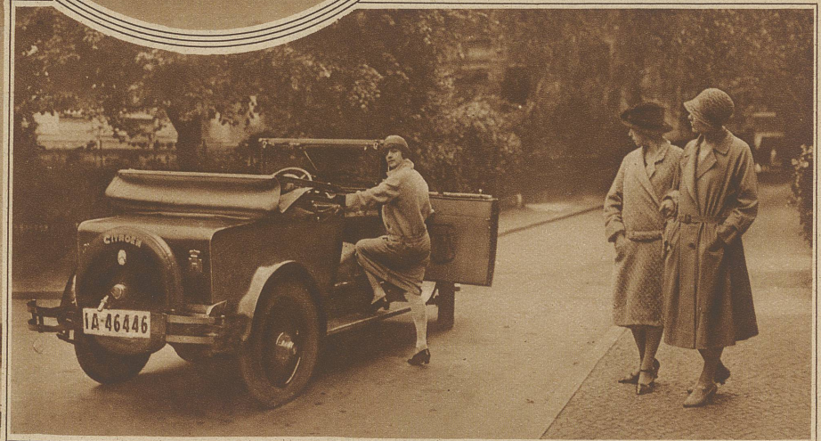
«Wo sie das Auto her hat?»

damit sie um so sicherer trifft. Nicht immer sind es äußerliche Dinge, denen die scharfe Zunge der lieben Mitschwester gilt. Es ist eine Eigenheit der Frau, daß in ihr „ein latenter Schulmeister“ steckt. Und der duldet nicht, daß andere eine andere Ansicht haben. Wie oft wird unter Freundinnen eine „andere Ansicht“ als Verbrechen angekreidet, zur Schlechtigkeit gestempelt.