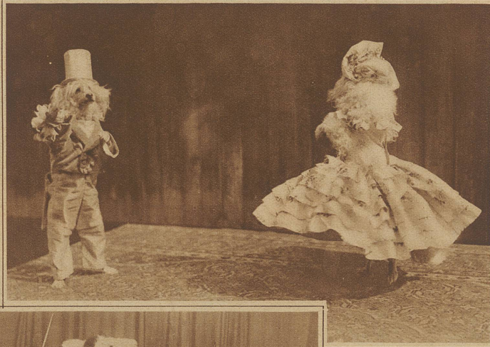
Aufforderung zum Tanz