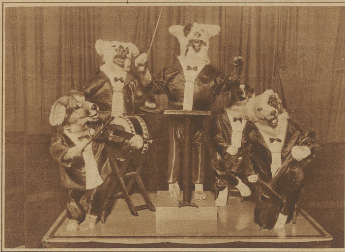
Ein vierbeiniges Orchester