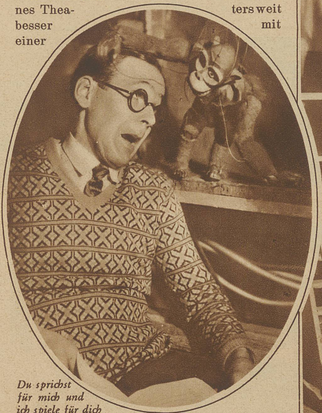
Du sprichst für mich und ich spiele für dich

weiß genau, daß die ganze Geschichte schrecklich prosaisch, alles eher als Zauber ist. Man könnte das Bühnenhaus eines Theaters weit besser mit einer