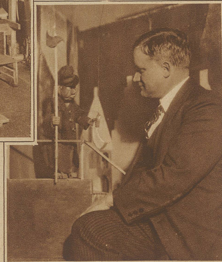
Der sprechende und spielende Hansjoggel

Maschinenhalle, als mit einem Zauberreiche vergleichen. Und wie auf der großen Bühne, so ist es auch im Spielhaus der Marionetten, so – und doch wieder ganz anders. Es ist alles so reizvoll zierlich, so putzig sauber und so niedlich klein. Schon die Bühne erinnert an eine Puppenstube und die Figuren scheinen direkt aus der Spielwarenfabrik zu kommen. Allerdings scheint dies nur so auf den ersten Blick, denn bei näherem Zusehen erweisen sie sich so kunstvoll ausgeführt, daß sie mit berechtigtem Stolz auf all das herabsehen können, was eigentlich Puppe heißt und hätten diese Figürchen noch die Sprache, sie würden bestimmt ihren klingenden Namen: Marionetten mit höchster Würde aussprechen. Von außen besehen – und wer wollte so neugierig sein und bis in das Innere vordringen? – fehlt ihnen ja nur die Sprache zum Leben. Aber diese raffinierten Dingerehen borgen sich einfach alles, was ihnen die Natur versagt. Wohl ist alles an ihnen beweglich – aber es bewegt sich nicht, wenn es nicht von einem Menschen gelenkt wird. Die Marionette baumelt an einem ganzen Knäuel von Fäden und jeder hat seine ganz besondere Bestimmung. Zieht man den einen leicht an, dann wackelt die Figur