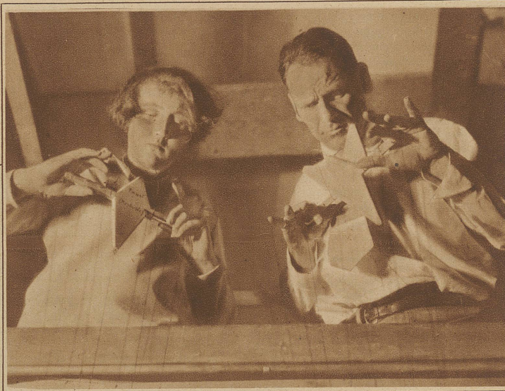
Marionettenführer bei der Arbeit

Mit Bildern aus dem Schweizer Marionettentheater im Kunstgewerbemuseum Zürich