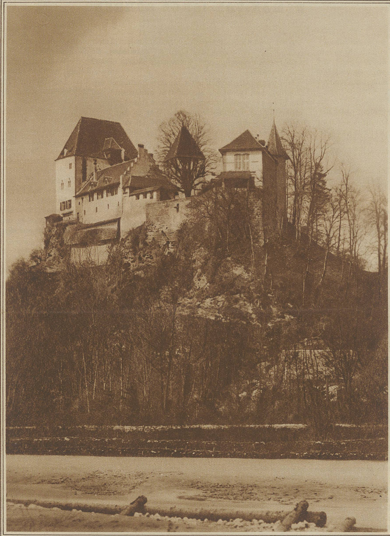
Schloß Burgdorf von der Emme aus