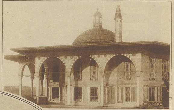
Der herrliche Bagdad-Kiosk, ein Schmuckstück türkischer Architektur, wurde zur Erinnerung an die Eroberung Bagdaads in den Jahren 1634-39 erbaut

dieser Stadt hin- und herkreuzen, welche solch' prunkvolle Perspektiven entrollt, um dann gesättigt von diesem Blick auf Türme und Mauern, Kuppeln und Minarets, Buchten und Meere, beim feenhaften Sonnenuntergang den Dardanellen entgegenzufahren. Eine unvergessliche Fata Mor-