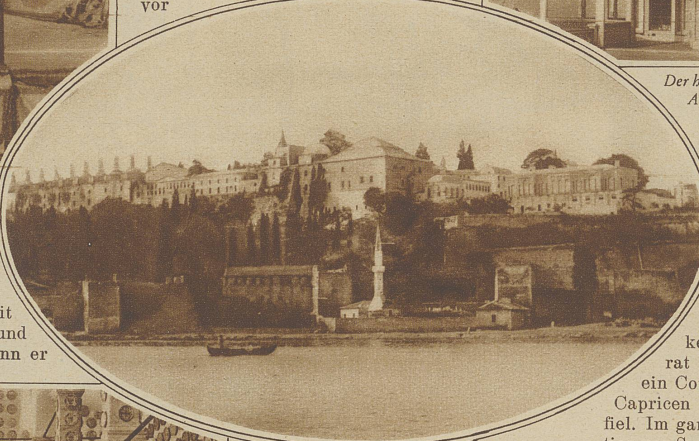
Blick vom Marmarameer auf den Serail. Links die Küchen des kaiserlichen Haushaltes

lata, das ebensogut Belgrad heißen könnte und auf das kleinasiatische Skutari, bietet sich dem Fremdling vom Serail aus bei Sonnenaufgang oder -untergang ein wahrhaft märchenhafter Anblick. Man sollte Konstantinopel und die ganze Umgebung nur vom Serail aus genießen, oder aber vom Schwarzen Meer durch den Bosphorus herkommend, ein paar Stunden vor