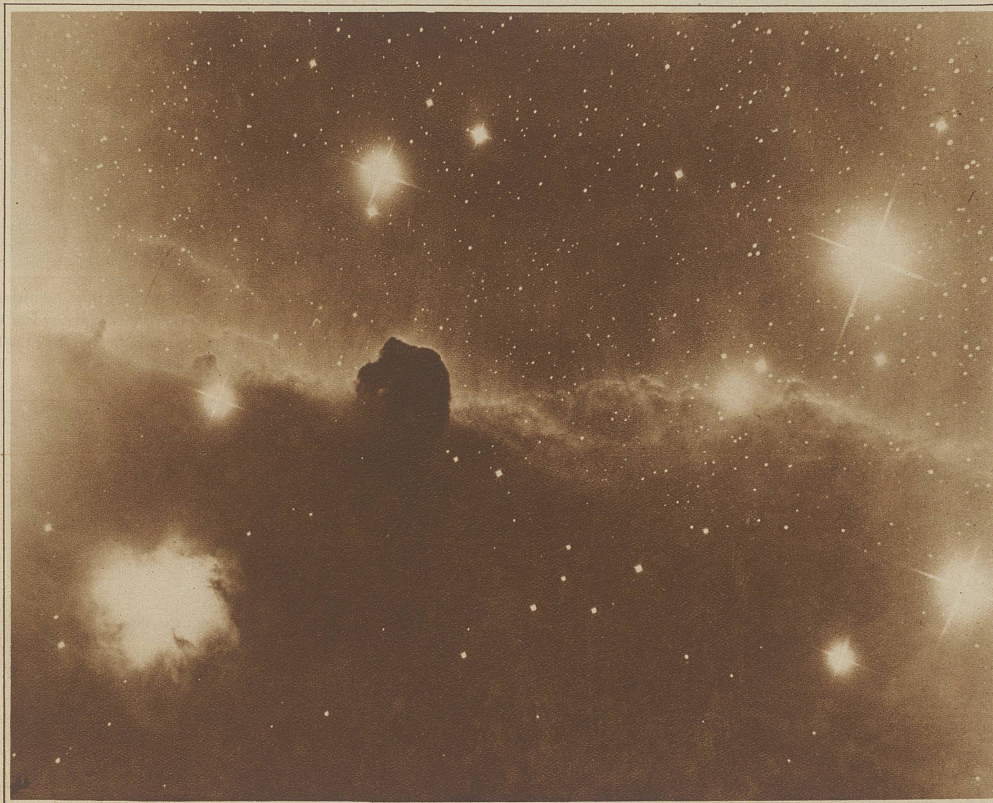
Helle und dunkle Nebel beim östlichsten Gürtelstern Orions.

Anderer Verhältnisse zeigen dagegen die übrigen Orionsterne. Schon ihr weißes Licht läßt äußerst hohe Temperatur und Strahlenkraft vermuten. Wir kennen diesen Sternstypus, der im allgemeinen die Milchstraße bevorzugt, als sogenannte Heliumsterne. Die große Leuchtkraft hat ihren Grund nicht in der großen Oberfläche wie bei Betelgeuze, sondern der Hauptsache nach in den enorm hohen Oberflächentemperaturen. Während ihr Volumen das der Sonne nur um das 10–20fache übertrifft, liegen die Hitzgrade alle über 15 000°, betragen also ungefähr das Dreifache der Sonne. Dementsprechend ist ihre Leuchtkraft 10–20 000 mal größer als die unserer