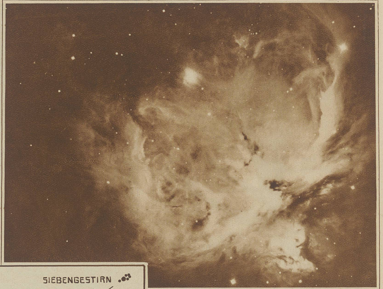
Der große Orion-Nebel.

Aufnahme der Mt. Wilson-Sternwarte in Kalifornien. Spiegelteleskop mit 260 cm Öffnung. Belichtungszeit 3 Stunden