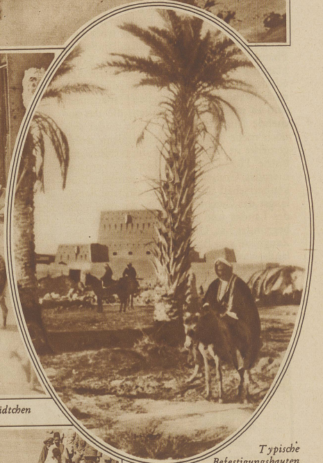
Typische Befestigungsbauten eines babylonischen Dorfes