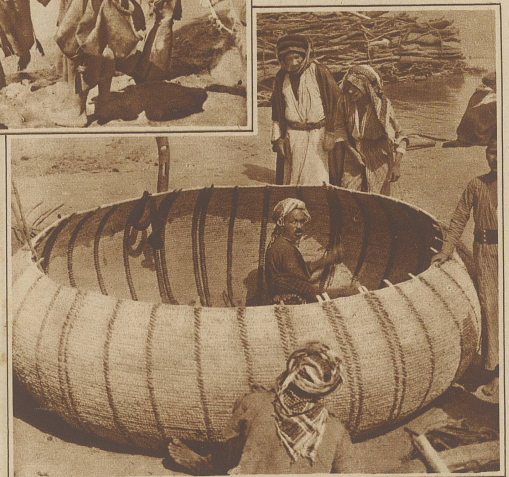
Beim Bootbauer. Die aus Dattelpalmenzweigen geflochtenen Boote vermögen, wie das obere Bild zeigt, bis zu 20 Personen zu tragen