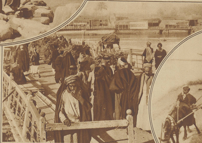
Der Verkehr auf der Tigrisbrücke gegen die Altstadt von Bagdad

wie nur die stärkste Phantasie sich ausmalen konnte, wenn heute in diesem Lande Flieger — ein Mittelholzer, andre nach ihm — aufsteigen, die kurdischen Berge entlang ziehen, um irgendwo zu landen, vielleicht auf den Bahrein-Inseln, den Inseln von Waak-al-Waak, wie sie in Tausendeneiner Nacht hießen: eine Geistertrommel führte einst aus starrer iranischer oder arabischer Wüste in das Feenreich von Waak-al-Waak, heute rattert der Flugzeugmotor und tut ein gleiches in Wirklichkeit. Im Alltag und in großen Augenblicken fließen in diesem seltsamen Lande Traum und Wirklichkeit zusammen . . . Zweistromland, Tausendundeine Nacht einst und heute . . .