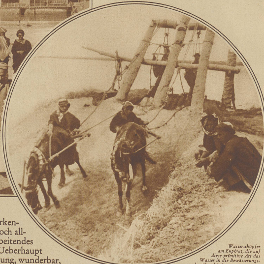
Wasserschöpfer am Esel, die auf diese primitive Art das Wasser in die Bewässerungskanalität schöpfen

heute erst der Verwahrlosung durch die völlig degenerierte Türkenherrschaft unter dem straffen, sicher nicht selbstlosen und dennoch all-gemein nützlichen Griff der Britengewalt wieder ein nützlich arbeitendes Glied am Gesamtkörper der Menschheit zu werden verspricht. / Ueberhaupt dieses Zweistromland: ist das alles nicht eine Wunschtraumerfüllung, wunderbar,