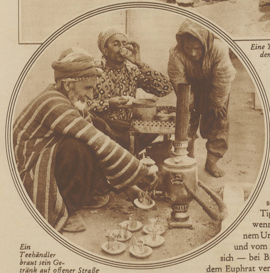
Ein Teehändler brant sein Getränk auf offener Straße

ebenen Lauf ins persische Meer ergießt. Weit ist hier alles, grandios, furchtbar, zeugt zwingend jene herrschende Welt von Geistern und wilden Mächten, die über dem König und dem Krieger, dem Gelehrten und dem Kaufmann waltet und das Wunder von Tausendundeiner Nacht heute noch als lebendigste Gegenwart vor Au-