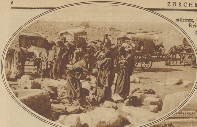
Halteplatz auf einer alten Karawanenstraße durch Nord-Mesopotamien

gen führt. / So wird hier Strom und Gebirge, der Händler und seine Strafe Erinnerung und Abbild einer gewaltigen vergangenen Zeit, natürlich bleibt es unserem Bildungsgedächtnis und unserer trotz allen Leugnungen recht regen abendländischen Phantasie vorbehalten, den weisen König Harun al Raschid und den Kaufmann Alad-din sich unter den Typen Bagdads heute noch wandelnd vorzustellen; manchmal sind es prachtvolle Gestalten, die das suchende Auge trifft, aber sicher findet sich noch mehr Elend und Verfall, denn wohl-gemerkt ist es nicht mehr die persisch-arabische Hochkultur die hier ihr verdämmerndes Greisenalter zeigt, sondern Türkenherrschaft und Mongolenstürme haben längst das Geschlecht getilgt, das die Größe des Landes und seine Ueberlieferung nun begründet hat. Und davon schweigen diese Zeugnisse von Bagdad und aus dem Tigrisland, was Jahrtausende vorher über sie