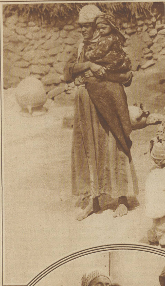
Eine Yezides-Familie aus dem Gebiet des oberen Tigris