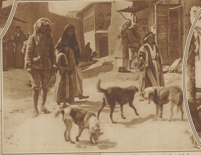
Straßenbild aus einem Araberstädtchen

Das Wunder stirbt nicht aus, es nimmt nur andere Formen an, in denen es sich sehen läßt und wir selber sehen mit andern Augen als frühere Menschen, aber das Recht