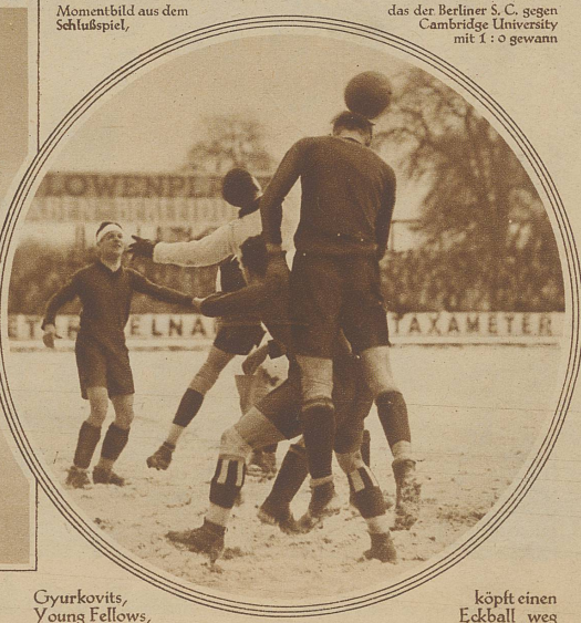
Momentbild aus dem Schußspiel,