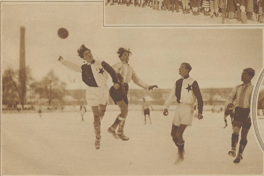
Slavias Verteidigung in der Abwehr im Spiel gegen F. C. Zürich