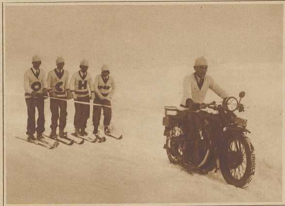
Ein neuer Sport: Skikjöring mit dem Motorrad