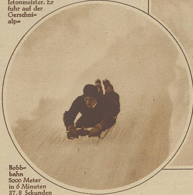
Bobb- bahn 5000 Meter in 6 Minuten 37,8 Sekunden