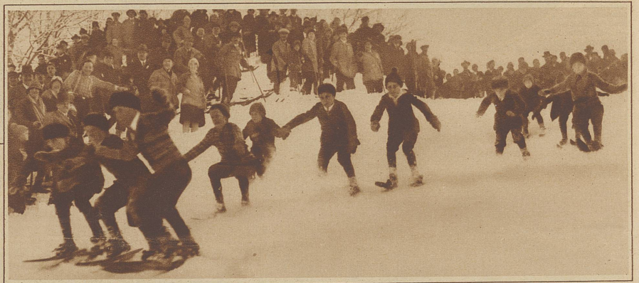
Momentbild aus dem Faßdaubenrennen der Buben