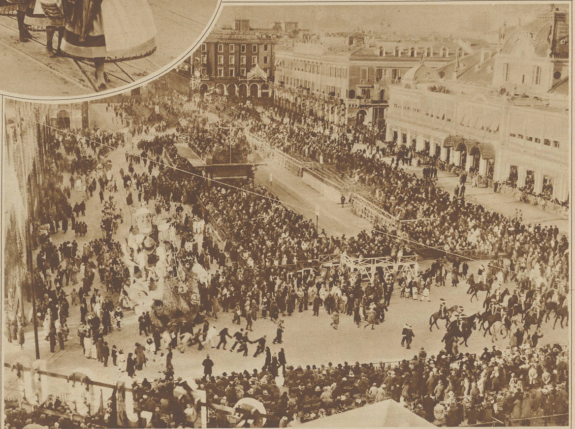
Rechts: Blick auf den Massena-platz während des Einzuges des Prinzen Karneval (links vorn im Bilde)

Prinz Karneval ist in diesem Jahre in den Garten der Hesperiden eingedrungen. Er hielt seinen Einzug in Nizza auf dem Rücken des überwältigten Drachen. Die linke Hand zeigt einen eroberten «goldenen Apfel» und auf dem Helm sitzt ein Vogel, der das Lied des Karnevals 1929 zwitschert