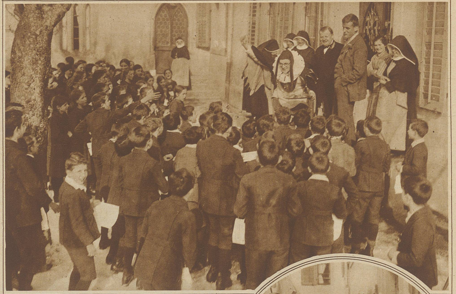
Der Hofnarr verteilt in Rathausen unter die Schuljugend allerlei Süßigkeiten