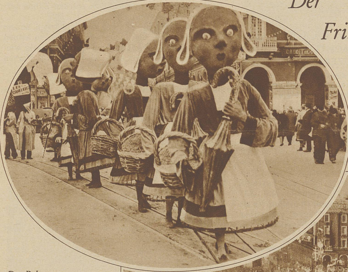
Die Bekassinen (Wasserschneppen) im Umzug