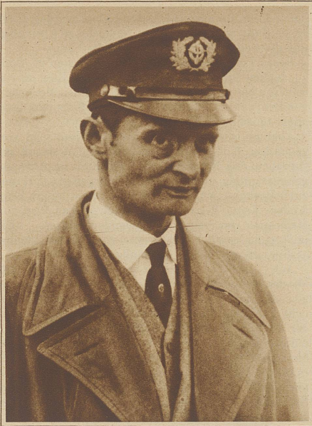
Freiherr von Hünefeld, der zusammen mit Hauptmann Köhl und Oberst Fitzmaurice die erste und bis heute einzige Ozeanüberquerung im Flugzeug in ost-westlicher Richtung ausführte, ist an den Folgen einer Magen- und Darmoperation gestorben