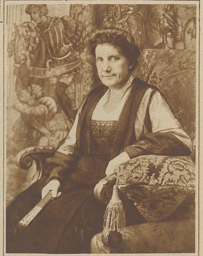
Bild rechts: Maria Christina, Königin-Mutter von Spanien , ist in Madrid im Alter von 71 Jahren gestorben. Sie war eine Tochter des Erzherzogs Karl Ferdinand von Oesterreich. Im Jahre 1879 entsagte sie ihren Nachfolgerechten in der Doppelmonarchie und vermählte sich mit König Alphons XII. von Spanien, der seine erste Gemahlin verloren hatte. Aber schon im November 1885 starb Alphons XII. und die Königin wurde zur Regentin und Reichsverweserin bestimmt, weil die Möglichkeit der späteren Geburt eines männlichen Thronfolgers vorlag. In der Tat wurde am 17. Mai 1886 der Königin ein Sohn geboren, der unmittelbar darauf unter dem Namen Alphons XIII. zum König proklamiert wurde. Die Regentschaft seiner Mutter dauerte nun während der Minderjährigkeit des jungen Fürsten weiter, bis im Jahre 1902 ihr damals 16jähriger Sohn, der heutige König, die Regierung übernahm