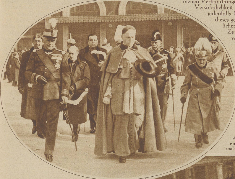
Aus der Beisetzungsfeier. Primo de Rivera (links), der Kardinal von Madrid, und der 91jährige Marschall Don Fernando Weyler (rechts) im Trauerzuge

In Paris sind die Experten Frankreichs, Englands, Italiens, Belgiens, der Vereinigten Staaten, Japans und Deutschlands zur Ausarbeitung von Vorschlägen für die endgültige Regelung des Reparationsproblems zusammengesetreten. Den Vorsitz führt der amerikanische Delegierte Owen Young, der schon im Jahre 1924 an der Ausarbeitung des Dawesplanes großen Anteil hatte. Reichsbankdirektor Dr. Schacht fällt die schwere Aufgabe der Darlegung der deutschen Zahlungsfähigkeit zu. Die am Montag aufgenommenen Verhandlungen wurden im Geiste der Versöhnlichkeit geführt und man darf jedenfalls hoffen, daß die Lösung dieses gewaltigen weltwirtschaftlichen Problems in kollegialer Zusammenarbeit gesucht werde. Jedenfalls zeigen die Delegierten auf dem Bilde ein vergnügtes Lachen