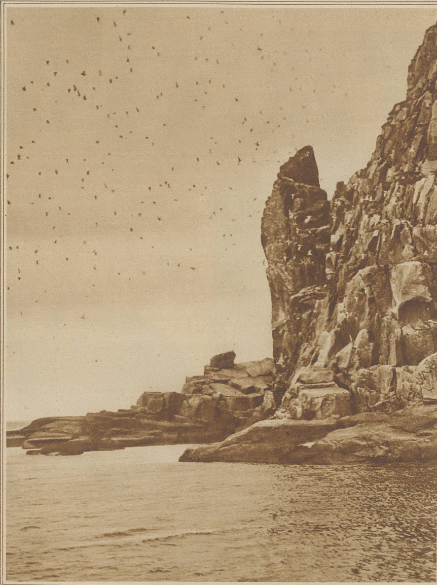
Ein Vogelfelsen an der wilden Eismeerküste Norwegens, auf dem Hunderttausende von Eiderenten und Möven nisten

Natascha kann von ihrem Versteck aus fast die ganze Tür übersehen. Sie wird aber keine Zeit mehr haben aufzuspringen und sich zu retten, wenn Ljuskow durch diese Türe tritt. Sie wird Ljuskow wehrlos ausgeliefert sein, wehrloser als zuvor.