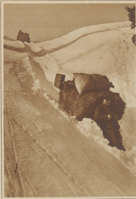
Heutransport von der Alp

Im nämlichen Augenblicke fühlt Natascha eine