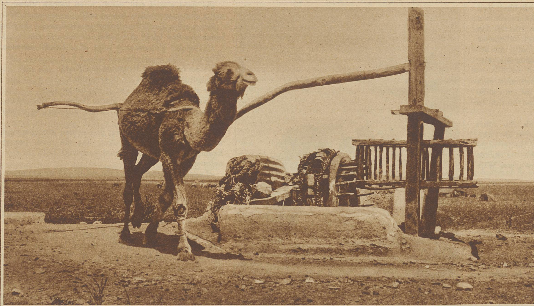
In den marokkanischen Wüstengebieten bedienen sich die Eingeborenen des Schöpfrades zur Bewässerung der spärlichen Weiden. An Stelle der Zahnräder werden Speichenkränze aus Holz als Getriebe verwendet

«Sie frieren, Natascha Petrowna. Darf ich Sie nicht in meinen Mantel hüllen?»