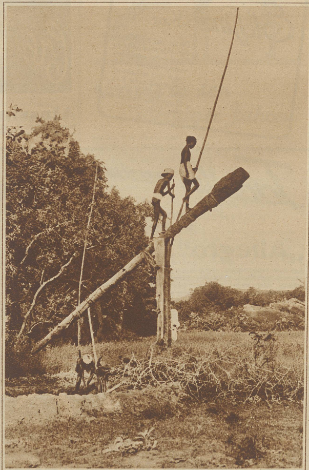
Noch primitiver ist die Methode der Hindus. Die beiden Männer beben durch ihr Gewicht den gefüllten Wasserkübel aus dem Sodbrunnen