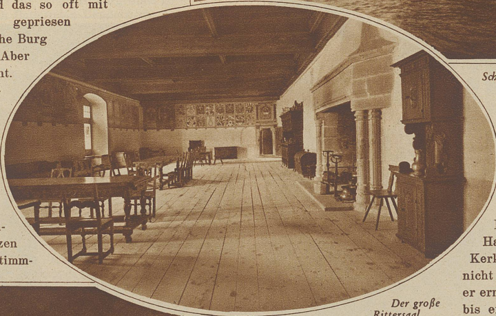
Der große Rittersaal

schmachteten die Gefangenen, starben unter entsetzlichen Entbehrungen langsam dahin, oder aber harrten einem strengen Gericht entgegen, das dann auch hier in einem Galgenraum vollstreckt wurde, von dem aus die Leichen durch eine Oeffnung in den See geworfen wurden. Besonders bekannt geworden ist der Kerker Bonivards, der eine lange Halle darstellt. Franz von Bonivards, der von 1530—1536 hier in Gefangenschaft lag, wurde als der Sohn