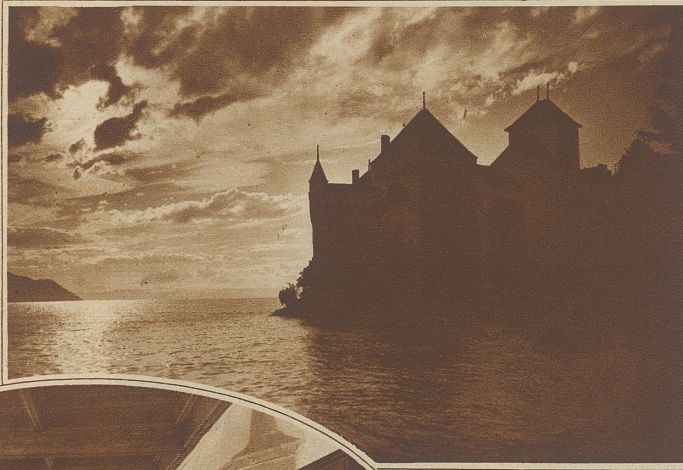
Schloß Chillon bei Gewitterstimmung

Es gibt in der Schweiz kein Schloß, das so allgemein bekannt, das so ungezählte Male in Bildern festgehalten und das so oft mit begeisterten Worten gepriesen wurde, wie die herrliche Burg Chillon am Genfersee. Aber auch nicht mit Unrecht. In ganz unvergleichlich schöner Lage ragt das Schloß scheinbar aus den blauen Fluten des Sees auf und reckt sich in stolzer Beständigkeit, von kräftigen Türmen bewehrt, zu imponierender Größe, der ganzen Landschaft einen bestimm-