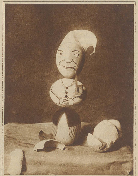
Der deutsche Michel