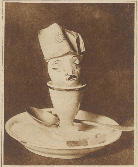
Amanullah, der verjagte König

Zu Ostern kommt dem Ei, das uns immer eine nahrhafte Speise ist, durch alte Sitte und Brauch eine erhöhte Bedeutung zu, die der langohrige und hasenherzige Meisterlampe nicht zu bestehen vermag. Es ist das Symbol der Auferstehung. «Darum», sagt Jeremias Gotthelf, «haben die Eier am Ostertag ihre wahre hohe Bedeutung, sie sind gleichsam Wappen und Sinnbild dieses Tages. Man hat viel über der Ostereier Ursprung und Bedeutung nachgedacht und geschrieben. Die Sache ist doch so einfach. Das Ei ist eine geheimnisvolle Kapsel, welche ein Werdendes birgt, ein rauhes Grab, aus welchem, wenn die Schale bricht, ein neues feineres Leben zutage tritt. Darum freut man sich absonderlich der Ostereier, dessen eigentliches Leben in der Zukunft ist, dessen eigentliches Wesen noch verhüllt und verborgen liegt. Darum ist Ostern der Kinder Freudentag, darum lieben sie so sehr die Ostereier. Der Kin-