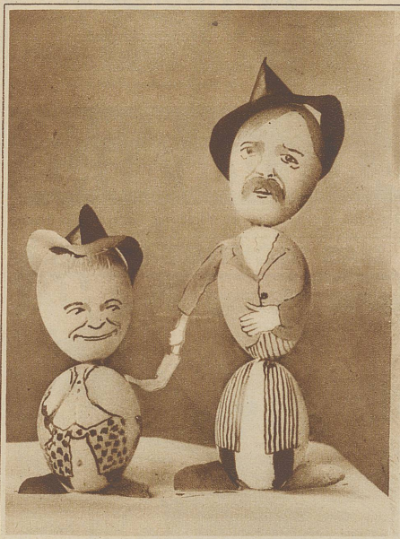
Die beiden Filmgestalten Pat und Patachon

Ich lobe mir das Osterei. Der Ostertag ist, was Jeremias Gotthelf in einer nicht allgemein bekannten Schilderung eines bernischen Osterbrauches schreibt, «der schöne und hehre, der alle Jahre uns das Zeugnis bringt, daß aufersteht, was begraben worden, daß an die Sonne soll, was im Verborgenen liegt. Er bringt als Frühlingsengel Freude allen Kreaturen, auch denen, welche weder Jahre noch Tage zählen können, welche keine Ahnung haben von des Tages hoher Bedeutung, als des immer wiederkehrenden Boten, der das Dasein einer andern Welt verkündet.»