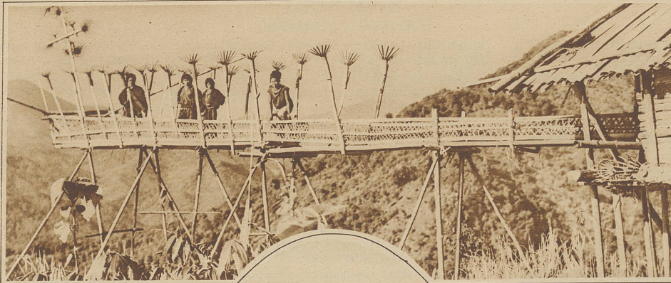
Sklavinnen eines reichen Burmanen. Sie haben nichts anderes zu tun, als die eigenartigen, fächerförmigen Büschel, die zur

Trotz der sicher anerkennenswerten Bemühungen der englischen Regierung, die Sklavenhaltung im britischen Weltreich völlig auszurotten, gibt es auch heute noch Gebiete, wo die Sklaverei in hoher Blüte steht. So beispielsweise im nördlichen Teil von Burma (Hinterindien), wo es einer Expedition des Kommissärs Barnard unter großen Schwierigkeiten gelang, 4000 Sklaven die Freiheit zu geben. Noch vor drei Jahren war in dieser Gegend eine mit der gleichen Mission betraute Expedition unter Capt. West in einen Hinterhalt gelockt und erschossen worden. Barnard glaubt, daß noch Jahre vergehen werden, bis das Uebel völlig ausgerottet ist, dies um so mehr, als es manchmal recht schwierig sein soll, die Sklaven vom Vorteil ihrer Befreiung zu überzeugen