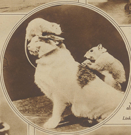
Links im Kreis: Seltsame Freundschaft