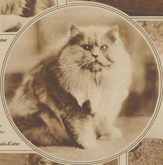
Rechts im Kreis: Prächtiger Blau-Male-Kater

Das anmutigste und zierlichste unserer Haustiere ist den meisten und schwersten Anschuldigungen ausgesetzt. Was so ein Kätzchen nicht alles tut, was es nicht tun sollte und was es nicht alles unterläßt, was man füglich von ihm erwarten könnte! Ihm gilt der Haß der prinzipiellen Tierfeinde, es wird verfolgt von den Vogelfreunden und es wird als un-