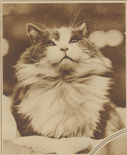
Blauweißer Angorakater, als Filmstar bekannt

läßt, dann macht man sich an ihrem Vogelraub mitverantwortlich, denn es entspricht dem primitivsten tierischen Instinkt, den Hunger zu stillen. Als Lebensretterin in den verschiedensten Gefahren hat sich die Katze schon häufig bewährt. Erst kürzlich wurde wieder ein solcher Fall bekannt. Eine alleinstehende Frau schlief fest in einem Zimmer, dessen Ofen giftiges Gas entwickelte. Im gleichen Zimmer schlief auch eine Katze. In ihr feines Näschen strömte auch der Gasgeruch und sie fing daher so stark zu miauen an, daß die Frau erwachte und sich noch retten konnte. Eine bekannte Schweizer Dichterin hält in ihrem abgelegenen Heim immer verschiedene Katzen. Für den Nachwuchs wird auf natürliche Weise gesorgt. Auf meine Frage, ob nicht in Anbetracht der einsamen Lage des Hauses ein Hund das angebrachtere Haustier wäre, wies die Dichterin auf die im Garten aufgestellten