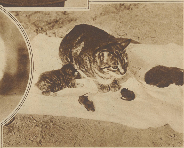
Seltene Freundschaft zwischen Katze und Maus