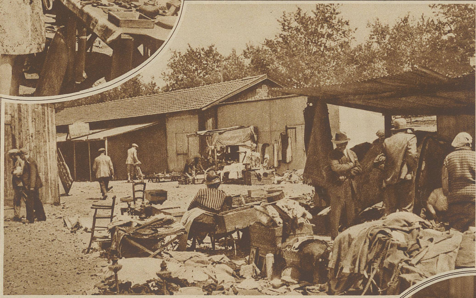
Was es alles gibt

Beständen des Lumpenmarktes. Die Hauptkonsumenten aber sind, wie schon gesagt, das Pariser Proletariat, und es ist merkwürdig genug, zu beobachten, wie weit die Verwendungsmöglichkeit, der Nutzungseffekt sozusagen, eines Gebrauchsgegenstandes geht, wenn die Not des Nutzenden es gebietet. Alte, durchlöcherichte Hosen, abgewetzte bis zur Unkenntlichkeit verbrauchte Kleidungsstücke, zerbrochenes Geschirr, alte Zeitschriften, Stiefel ohne Sohlen, und Kappen, verrostetes Blech, schmutzige, verlauste Bettfedern, alles findet seinen Käufer dort.