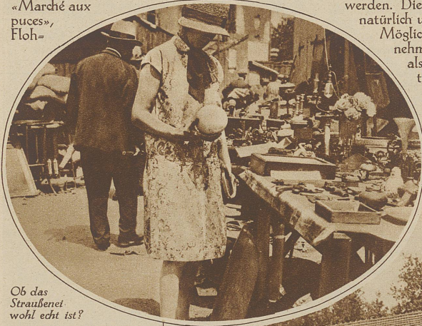
Ob das Straußener wohl echt ist?

markt, nennt deshalb auch der Volksmund jenen Bezirk an der Porte Clignancourt, hoch oben im Norden der Stadt, wo sie seit altersher ihr Domizil aufgeschlagen haben, wo sie an drei Tagen der Woche, Sonnabend, Sonntag und Montag Markt abhalten für die Aermsten der Armen, wo die Quersumme der Haushaltungsabfälle von ganz Paris sich ein Stelldichein gibt. Ihr Dasein beruht auf alter Tradition. Schon Heinrich Heine berichtet von ihnen, und ihr ehrbares Gewerbe spielt in der Geschichte Frankreichs keine geringe Rolle. So wollte man sie zur Zeit Louis Philipps, des Bürgerkönigs, einfach ausrotten, ihr Geschäft verbieten, weil die angehäuften Berge von Müll und Abfall mit Recht als Bazillenherde für die zu jener Zeit herrschende Cholera angesehen wurden. Doch die Lumpenhändler erklärten sich solida-