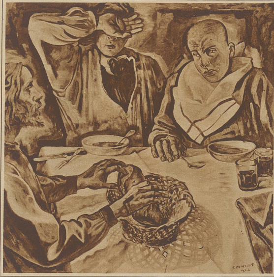
Bild rechts: Charles Humbert, La Chaux-de-Fonds. Die Pilger von Emaus

WER sich für die Kunst unseres Landes interessiert, der wird immer mit besonderer Freude die Turnus-Ausstellungen des Schweiz. Kunstvereins besuchen, weil ihm diese in trefflicher Weise einen orientierenden Ueberblick gewähren über das, was auf dem Gebiete der Malerei und Bildhauerei in der Gegenwart geleistet wird. Und diese Ausstellung hat auch noch den Vorzug, daß sie in ihrer Ganzheit in verschiedenen Städten gezeigt wird. In