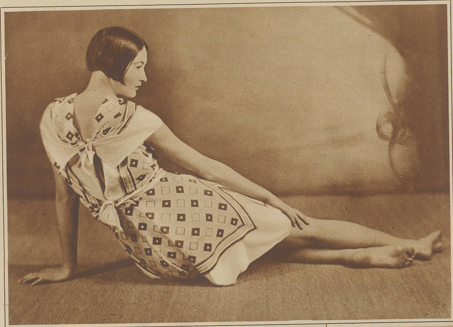
Vier Seidentücher ergeben ein reizendes Kleid für Garten und Strand

läßt auch einmal liegen, was nicht unbedingt nötig ist; und bei seinen Bekannten meldet man sich für zwei, drei Wochen ab. «Ich schneidere, bin in der Zeit weder für Spaziergänge noch für Besuche zu haben.» – Und hinterher stellt man sich im selbstgenähten Kleide vor.