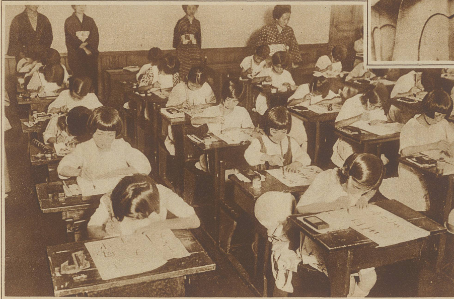
Bild links: Japanische ABC-Schützen beim Schreibunterricht. Die Buchstaben werden mit Pinseln auf große Blätter gemalt!

darüber! Man soll aber ja nicht denken, daß die japanischen Ehen unglücklich sind, keineswegs. Sie werden eben von ganz anderen Voraussetzungen aus geschlossen. Ein alter Japaner sagte mir einmal: «Sie schließen Ehen in himmelhochjauchendem Liebesrausch, die nachher doch oft unglücklich werden. Wir schließen Ehen aus Vernunftgründen, die nachher oft glücklich werden. Es hält sich also wohl die Wage». Die Einstellungen Europas und Asiens sind also, wie wir sehen, grundverschieden, doch ziehen wir es vor, bei unserer «himmelhochjauchenden» Liebe zu bleiben, denn sie ist doch ein Höhepunkt in unserem Dasein. Und mag der asiatische Familiensinn auch seine guten Seiten haben, so hat sie doch unser Individualismus ebenfalls.