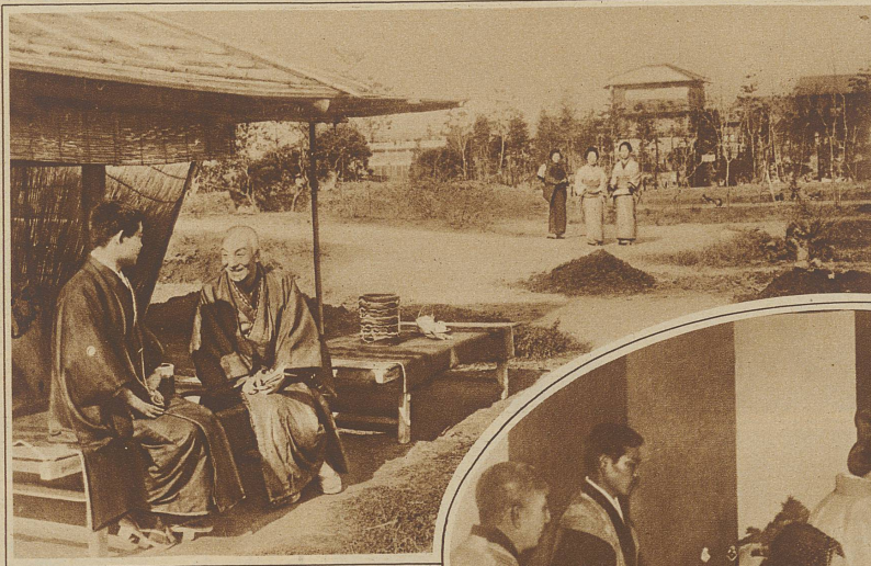
Bild rechts: Der Ehestifter oder Ehevermittler verhandelt mit einem jungen Mann