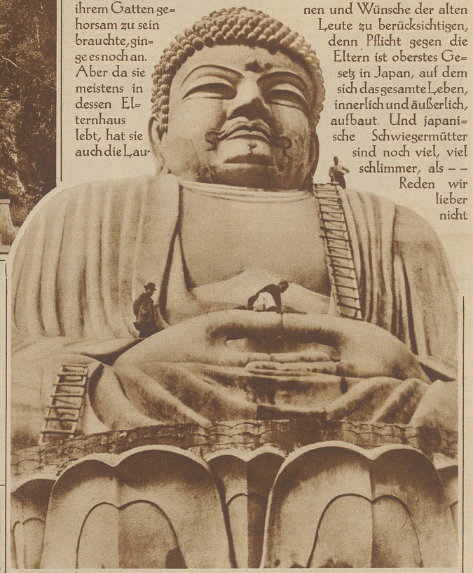
Die größte Buddhastatue ist im japanischen Badeort Beppu aufgestellt worden. Das Größenverhältnis läßt sich durch die mit der Reinigung beschäftigten Arbeiter vergleichen.

nen und Wünsche der alten Leute zu berücksichtigen, denn Pflicht gegen die Eltern ist oberstes Gesetz in Japan, auf dem sich das gesamte Leben, innerlich und äußerlich, aufbaut. Und japanische Schwiegermütter sind noch viel, viel schlimmer, als - - Reden wir lieber nicht