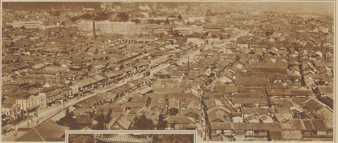
Das wiederaufgebaute Tokio mit den meist niedrigen Häusern, die bei Erdbeben weniger gefährdet sind

in seinem Hause den Vortritt. Diese Zeremonie hat wohl die Bedeutung einer inneren Vereinigung und wäre vielleicht unserem Ringtausch gleichzusetzen. Nach diesem «Tristan- und Isolde-Trunk» wechselt das Mädchen ihr weißes Kleid mit einem farbigen. Am Ende des Festes bringt der Vermittler und seine Frau die Braut in das Brautgemach. Hier wird nochmals die Zeremonie des Weintrinkens aus den drei Schälchen wiederholt, aber nun trinkt der junge Gatte zuerst. Damit wird dokumentiert, daß er als zukünftiger Herr und Meister zuerst auf Höflichkeit und Rücksicht Anspruch erhebt, denn die Frau soll fügsam und gehorsam sein. Ja, ja, beim Lesen dieser Zeilen wird mancher alte Ehemann stillschweigend eine Träne zerdrücken. Auch bei uns heißt es ja wohl irgendwo in der Bibel: «Er soll dein Herr sein, du sollst ihm untertan sein und gehorsam! - ??? - Reden wir lieber nicht darüber! - Nach einigen Tagen besucht das junge Paar die Eltern der Frau, und die Feierlichkeiten haben damit ihr Ende erreicht. Die ge-