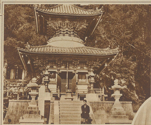
Kapelle des Nara-Tempelklosters in Tokio

in seinem Hause den Vortritt. Diese Zeremonie hat wohl die Bedeutung einer inneren Vereinigung und wäre vielleicht unserem Ringtausch gleichzusetzen. Nach diesem «Tristan- und Isolde-Trunk» wechselt das Mädchen ihr weißes Kleid mit einem farbigen. Am Ende des Festes bringt der Vermittler und seine Frau die Braut in das Brautgemach. Hier wird nochmals die Zeremonie des Weintrinkens aus den drei Schälchen wiederholt, aber nun trinkt der junge Gatte zuerst. Damit wird dokumentiert, daß er als zukünftiger Herr und Meister zuerst auf Höflichkeit und Rücksicht Anspruch erhebt, denn die Frau soll fügsam und gehorsam sein. Ja, ja, beim Lesen dieser Zeilen wird mancher alte Ehemann stillschweigend eine Träne zerdrücken. Auch bei uns heißt es ja wohl irgendwo in der Bibel: «Er soll dein Herr sein, du sollst ihm untertan sein und gehorsam! - ??? - Reden wir lieber nicht darüber! - Nach einigen Tagen besucht das junge Paar die Eltern der Frau, und die Feierlichkeiten haben damit ihr Ende erreicht. Die ge-