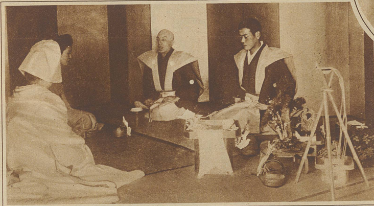
Der Ehestifter singt während der Trauung ein frohes Lied

verheiratet sein muß, denn unverheiratete Leute werden im Lande der aufgehenden Sonne für nicht ganz voll angesehen. Er arrangiert eine erste Zusammenkunft (mi-ai) der in Frage kommenden jungen Leute – meistens in seinem Hause –, um ihnen Gelegenheit zum gegenseitigen Kennenlernen zu geben. Nun, von «Kennenlernen» in unserem Sinne kann gar nicht die Rede sein. Meistens bestreitet die Kosten der Unterhaltung der Vermittler. Der junge Mann betrachtet sich die Auserkorene nach Möglichkeit, während das arme Würmchen verschämt und verschüchtert mit