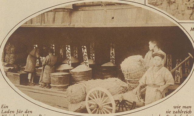
Ein Laden für den Kleinhandel von Reis,