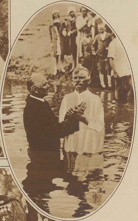
Eine Baptistentaufe in der Donau.

Unweit Budapest hielten die Baptisten kürzlich eine Taufe in der Donau ab. Die Baptisten sind eine christliche Sekte, sie verwerfen die Taufe unmündiger Kinder und vollziehen sie nur an solchen Erwachsenen, die Buße getan haben und lebendigen Glaubens sind. Im Bild spricht der Geistliche dem Täufling das Glaubensbekenntnis vor und taucht ihn dann nach altem Ritus unter Wasser