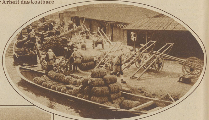
Verladen des in Strohsäcke verpackten Reises

Doch auch das Reisstroh findet zu Flechtwerk aller Art, u. a. den gebräuchlichen Sandalen, Verwendung. Vor allem werden die dicken, geflochtenen