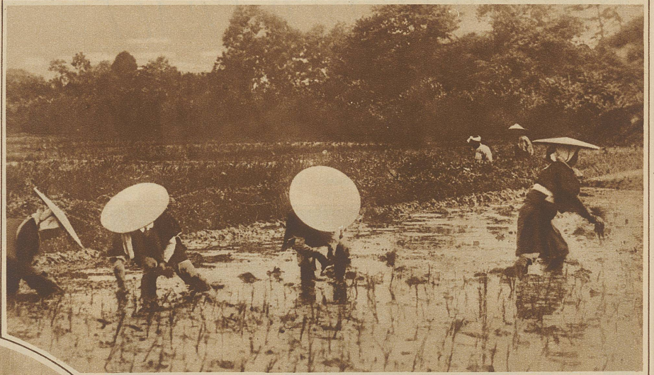
Männer und Frauen setzen die Reisschößlinge. Sie tragen große flache Hüte zum Schutz gegen den Sonnenbrand

Bereits vor 5000 Jahren wurde Reiskultur in China getrieben, von wo aus es dann auch — wie so vieles andere — Eingang in Japan fand. Heute