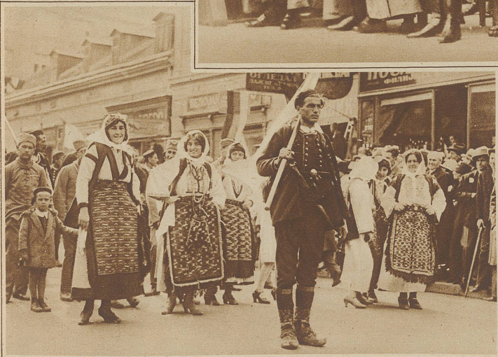
Die schönste Frau Dalmatiens. Nun hat auch Dalmatien seine Schönheitskönigin, die gelegentlich eines Trachtenfestes gewählt und von ihren Landsleuten im Triumph durch die Straßen Belgrads geführt wurde

Von links nach rechts: Fürstprimas Seredi, der päpstliche Nuntius Orsenigo, Ministerpräsident Graf Bethlen, Präsident des Oberhauses Baron Wlassisch und Präsident des Abgeordnetenhauses Graf Almassy