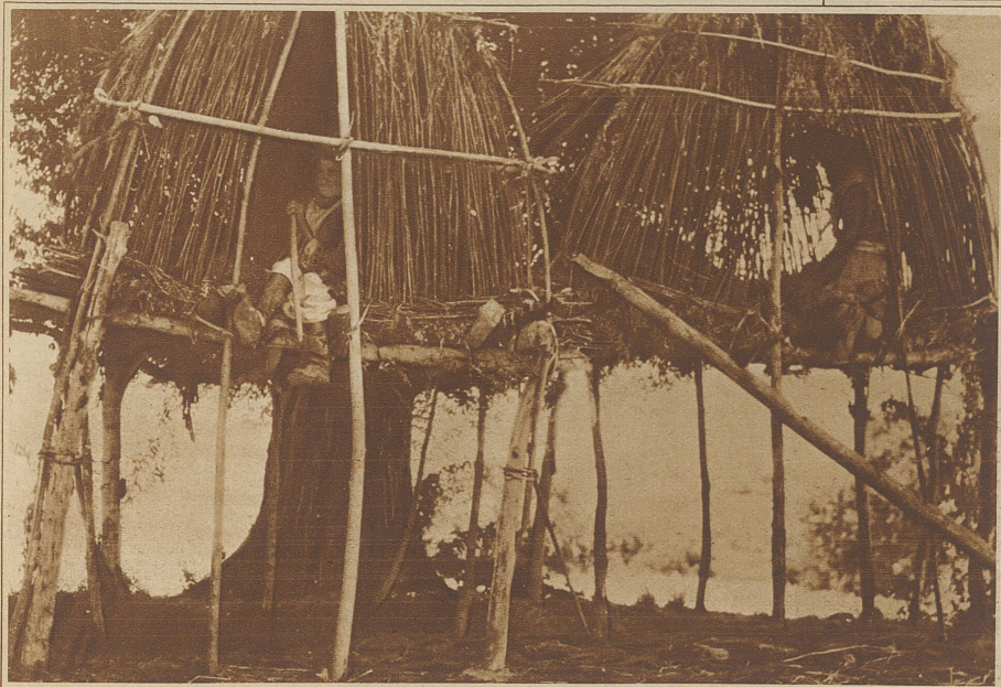
In den Flußtälern der westlichen Pamir bauen die Tadschiken besondere Zufluchtsstellen, um sich vor den Mücken zu retten, die in großen Schwärmen auf dem feuchten Boden leben

gegen den Pik Lenin unternommen wurde, den man wohl von Norden schon kannte, dessen Südseite aber, die einzig für eine Ersteigung in Frage kam, ganz unbekannt war. Es zeigte sich, daß der Berg von dieser Seite nicht erreichbar war und die Truppe vereinigte sich wieder mit den anderen Teilnehmern im Tanimasgebiet. Hier war man schon eifrig bei der Arbeit, es setzten eine Reihe Erkundungsvorstöße ein, die besonders die Erforschung der Uebergangsmöglichkeiten aus dem Gebirgsplateau des Seltau in die tiefen westlichen Pamirtäler zum Gegenstand hatten. Hierbei wurde zum erstenmal der Eisstrom des gewaltigen Fedtschenkogletschers in seinem mittleren Teil betreten, dessen Erforschung nun für längere Zeit die Haupttätigkeit der Expedition in Anspruch nahm und die Entdeckung an sich und vollständige Begehung dieses 72 km langen Gletschers, dem zweitlängsten Gletscher der Welt, gehört zu den Haupterfolgen der Reise. Nach einem Vorstoß auf dem sogenannten Notgemeinschaftsgletscher, bei dem die deutschen Alpinisten bei einem Angriff auf einen 6800 m hohen Berg in eine Lawine kamen, wurde das Lager am Rand des Fed-