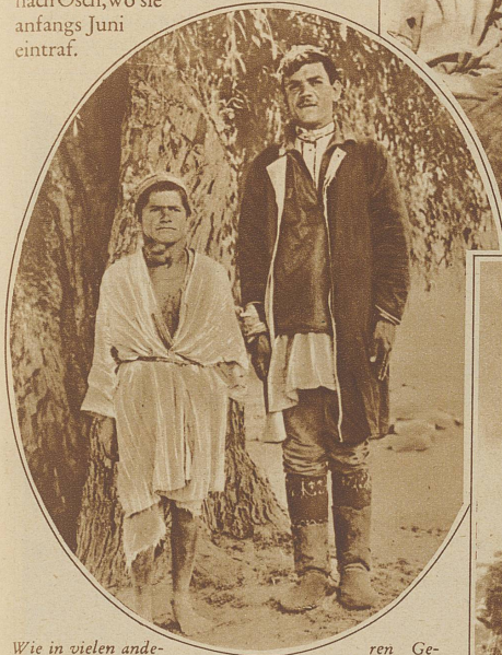
Wie in vielen anderen Gebirgsgegenden, herrscht auch in Pamir die Kropfkrankheit. Das Bild zeigt einen Tadschiken und einen kropfkranken Zwerg aus dem Wantschtal

Osch liegt schon bereits 50 km von der letzten Bahnstation der transkaspischen Linie, Andischan, entfernt etwa 900 m hoch am Rand des Gebirges. Die Karawane wurde dort ausgerüstet, alles Gepäck umgepackt und umgeladen und am 18. Juni verließ die Expedition Osch, mit einer großen Pferdekarawane, nachdem eine große Kamelkarawane mit den ganzen Proviantvorräten und vielen wissenschaftlichen Geräten schon einen Tag vorher ausgezogen war und ritt nach Südwesten dem Gebirge zu. Ueber die Höhe des Alai-Gebirges führte der Weg schnurgerade nach Süden hinunter in die weite Ebene des Alaitals, wo man nach 7 Tagereisen anlangte und