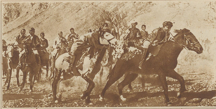
Ziegenbockstehlen, ein tadshikanisches Spiel, wobei die Teilnehmer einander einen Ziegenbock abzu jagen versuchen. Sieger ist derjenige, der mit dem Bock das Ziel erreicht