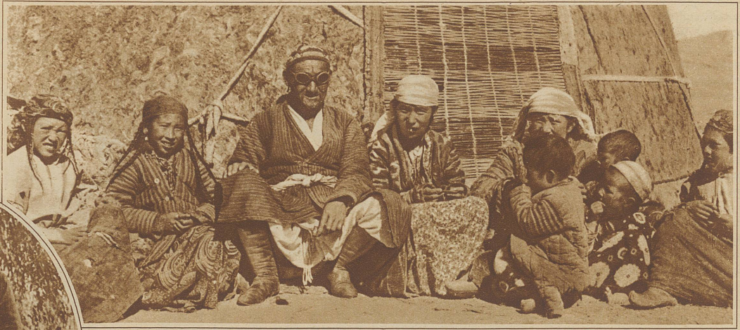
Ein Pamir-Kirgise, der die Expedition mitmachte, mit seiner Familie vor seiner Jurte am 4000 m hoch gelegenen See Kara-Kul

Die Expedition, deren Teilnehmer sich zunächst in Moskau vereinigten und von dort mit der Bahn in fünftägiger Reise, zuerst auf der transsibirischen Strecke, dann von Orenburg nach Süd-Osten in endloser Fahrt über die Ausläufer des Ural und durch die wüsten Steppen an den Ufern des Aralsees den Weg nahmen, erreichte Taschkent, die kulturelle Zentrale Turkestans und begab sich von hier nach Osch, wo sie anfangs Juni eintraf.