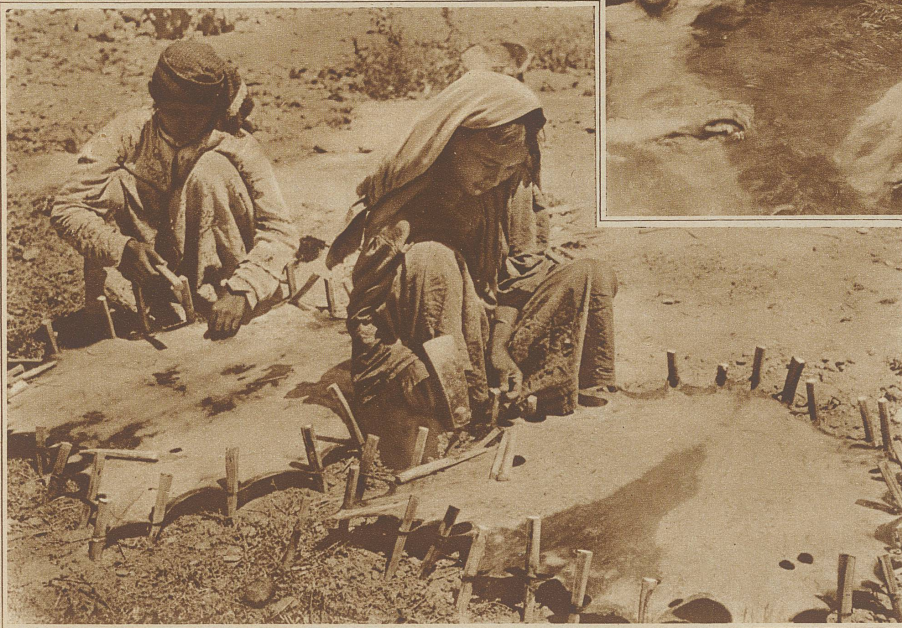
Ausspannen von Häuten, die hauptsächlich als Trommelfelle Verwendung finden

wofür 7 Stunden benötigt wurden. Die Leistungen hatten sich im vorangegangenen durch immer größere Anstrengungen in immer größerer Höhe doch so gesteigert, daß auch hier, trotz der großen Kälte und der durch den Sauerstoffmangel bedingten Anstrengungen, schließlich das Unternehmen bis zu seinem Ende durchgeführt werden konnte. Wegen der Erfrierungen die alle mehr oder weniger an den Füßen erlitten hatten und wegen des Umstands, daß die Träger statt zu warten offenbar wegen der großen Kälte ausgerissen waren, war der Rückweg ins Standlager, die sechste und siebente Nacht, die bei diesem Vorstoß auf dem Felde biwakiert werden mußte, noch eine besondere Anstrengung. Nach kurzer Erholung wurde am 15. Oktober das Hochgebirge verlassen.