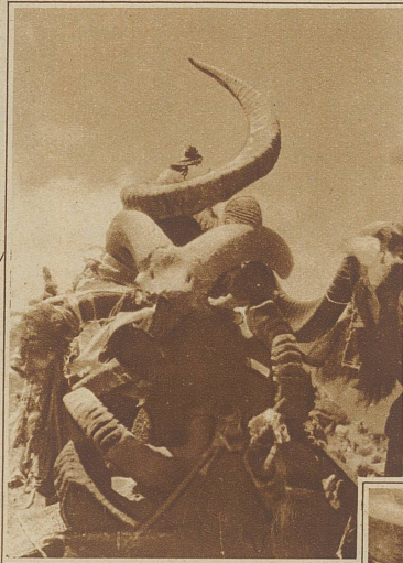
Ein geheiligtes Denkmal aus riesigen Hörnern von wilden Widdern auf dem Bergpaß Kisyl-Art

Osch liegt schon bereits 50 km von der letzten Bahnstation der transkaspischen Linie, Andischan, entfernt etwa 900 m hoch am Rand des Gebirges. Die Karawane wurde dort ausgerüstet, alles Gepäck umgepackt und umgeladen und am 18. Juni verließ die Expedition Osch, mit einer großen Pferdekarawane, nachdem eine große Kamelkarawane mit den ganzen Proviantvorräten und vielen wissenschaftlichen Geräten schon einen Tag vorher ausgezogen war und ritt nach Südwesten dem Gebirge zu. Ueber die Höhe des Alai-Gebirges führte der Weg schnurgerade nach Süden hinunter in die weite Ebene des Alaitals, wo man nach 7 Tagereisen anlangte und