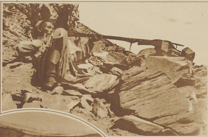
Auf der Lauer im Gebirge. Die Tadschiken benutzen heute noch, wie vor Hunderten von Jahren, die alte Feuersteinflinte

Die geographischen Verhältnisse waren ja schon von früheren Reisenden klargelegt worden, soweit es sich nicht um das eigentliche Hochgebirge handelte, in dessen Gletscher und Täler noch kein Menschenfuß den Weg gefunden hatte, deren Zusammenhänge noch völlig unbekannt waren. Aber für die Wissenschaft gab es überall noch vieles Neue zu finden, ein Sprachforscher untersuchte die Dialekte der Tadschiken, dieser seltsamen Bergvölker der südlichen Bergtäler, wohin sie durch die eindringenden Mongolen zurückgedrängt wurden. Ein Zoologe reiste im ganzen Pamir herum, um für die verschiedensten Untersuchungen Material in Gestalt von mehreren tausend Insekten zu sammeln, ein Geologe war an der Arbeit, ein Astronom machte die Festlegungen astronomischer Punkte mit Hilfe des von Paris aufgenommenen Zeitzeichens. Im eigentlichen Hochgebirge waren die Geodäten an der Arbeit, die mit der photogrammetrischen Methode eine Karte dieser Gebiete aufnahmen und die Bergsteiger, die in Zusammenarbeit mit den Geodäten, die erste Erkundungsarbeit im unbekanntem Land lei-