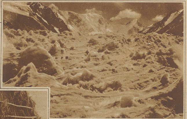
Blick auf den einer gewaltigen Stromschnelle gleichenden Fedtschenkogletscher