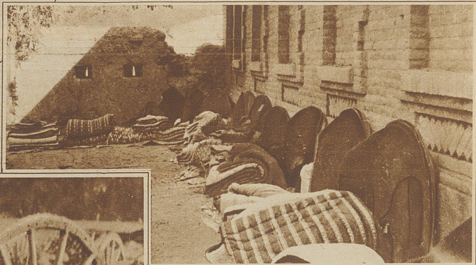
Usbekinnen, nach alter Sitte in dicke schwarze Schleier gehüllt, verkaufen an der Straße warme Decken und gefütterte Chalate