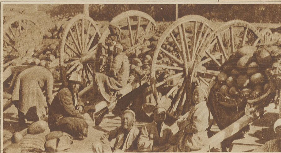
Die Kirgisen fahren mit ihren hochrädigen Arbas, beladen mit Melonen und andern Früchten, auf den Basar ins Städtchen Ösch