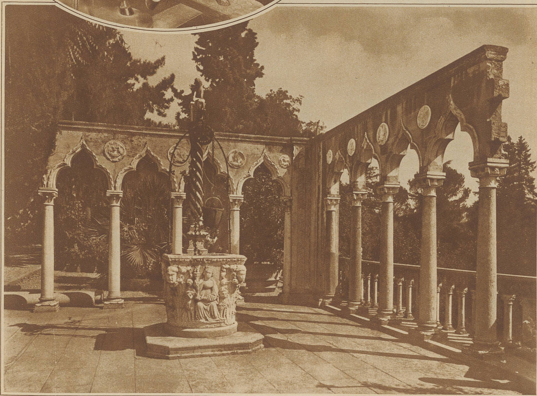
Säulenhalle mit Brunnen in der Villa Stibbert