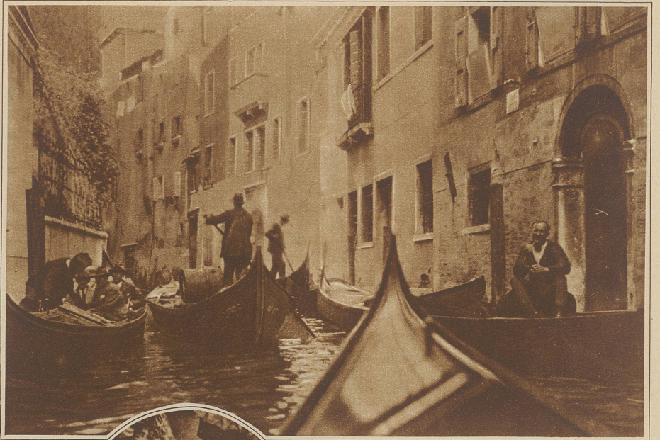
Regier Gondelverkehr auf den Kanälen der innern Stadt

Selbstverständlich, wie immer, wenn viele Fremde anwesend sind, fand auch ein Aufmarsch der Faschisten statt, Erwachsene und Kinder in der berühmten schwarzen Bluse zogen stolz einher, die Tauben, frecher und gefrässiger denn je, fraßen aus der Hand teure Maiskörner, die an Ständen feilgeboten werden und ließen sich gnädig photographieren, kurz, es schien, als ob Frau Sorge hier völlig unbekannt wäre und einzig und allein Frohsinn und gute Laune herrschen könnten. Ein Gang jedoch allein schon durch die engen Gassen längs der Kanäle in der Nähe des Platzes kann einen davon überzeugen, daß Armut wie überall, so auch hier in reichem Maße vorhanden ist. Alte, verfallene Bauten, dumpfe, übelriechende Häuser an Stelle der stolzen Paläste dort und am Canale grande, zerlumpfte Frauen, skrofulöse Kinder, die nur in der Umgebung und unter der strahlenden, südlichen Sonne mehr malerisch, als verelendet wirken, das ist die andere Seite Venedigs, die un-