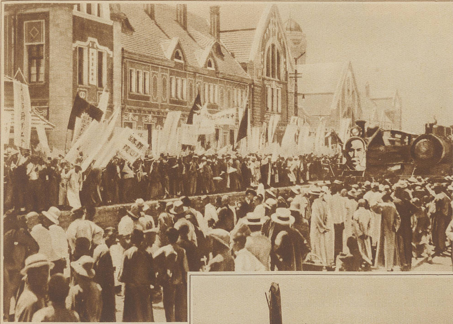
Die Leiche des im Jahre 1925 verstorbenen chinesischen Nationalhelden und ersten Präsidenten der Republik, Dr. Sun Yat Sen, ist mit großer Feierlichkeit von Peking in das Mausoleum bei Nanking übergeführt worden. Vorn auf der Lokomotive des Sonderzuges sieht man das Porträt des Verstorbenen