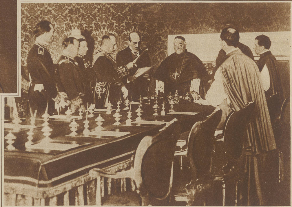
Die Ratifikation der Lateranverträge erfolgte im Vatikan durch feierlichen Austausch der Urkunden zwischen Kardinal-Staatssekretär Gasparri (Mitte) und Mussolini