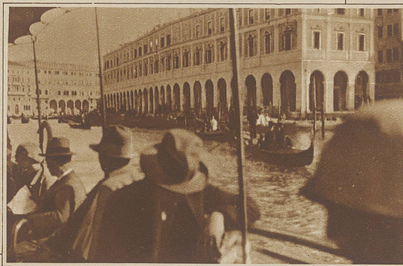
Vor den Markthallen herrscht den ganzen Tag ein reges Leben