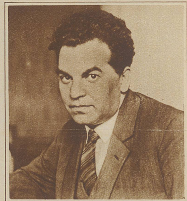
Rechts nebenstehend: Schachmeister Reti, der sich wiederholt auf großen internationalen Turnieren auszeichnete und auch bei uns durch seine Simultan- und Blindpartien in bester Erinnerung steht, ist im Alter von 40 Jahren an Scharlach gestorben