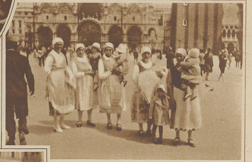
Die Kindermädchen auf dem Markusplatz

Die Saison hat noch nicht begonnen, und wo später die Geldaristokratie der ganzen Welt sich ein Rendezvous gibt, startete ein öder und absolut nicht