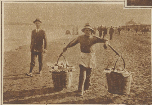
Orangenverkäufer am Lido

übermäßig reinlicher Strand. Die großen, luxuriösen Hotels halten ihre Pforten noch geschlossen, lediglich ein einsamer Portier, dessen Stolz und unnachahmliche Vornehmheit zweifellos auch erst mit der Saison beginnt, gab mir freundlich Auskunft. Jetzt noch ist dieser Strand dem Volk vorbehalten, das den schönen Sonntag benutzte, um hier, am freien, offenen Meer den nicht gerade angenehmen Garküchendüften seiner armseligen