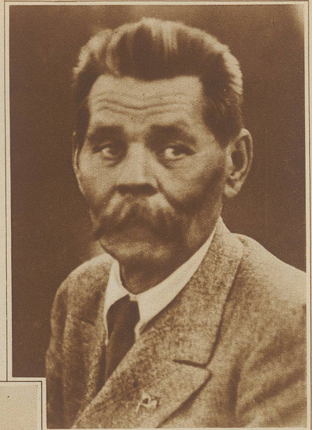
Vom Schriftsteller zum Staatsmann. Der soeben aus Italien zurückgekehrte Maxim Gorki wurde auf dem Sowjet-Kongress zum Mitglied des Zentral-Vollzugsausschusses, einer der höchsten Regierungsinstanzen der Sowjetunion, gewählt