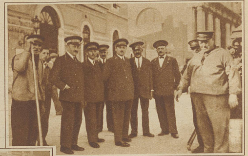
Ruhe vor dem Sturm. Die Hotelportiers am Bahnhof vor Ankniff eines Zuges

angehörten, wie wenn die Liebe aufgehört habe, zu existieren und damit auch Venedig, das Eldorado der jungen Ehepaare. Nun, ich kann aus eigener Anschauung das Gegenteil bezeugen. Venezia, die Stolze, Wasserumrauschte, steht nach wie vor auf dem alten Fleck und der zugereisten Ehepaare gibt es darin mehr als je zuvor. Man begegnet ihnen schon bei der Ankunft auf dem Bahnhof, ein wenig schüchtern meist gegenüber dem Ansturm der Hotelportiers, die, eine Legion an Zahl, sich ihrer nebst