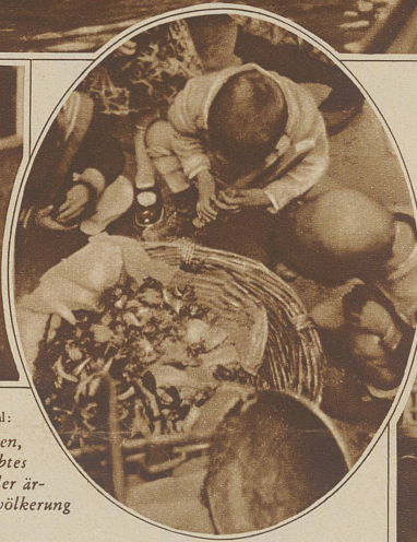
Bild im Oval: Seekrabben, ein beliebtes Gericht der är- mern Bevölkerung

ter der Zeit leidet genau wie Berlin oder sonst eine Großstadt. Immerhin, eines muß man dem heutigen Regime als Verdienst anrechnen: Die vielen Bettler, die früher die Stadt bevölkerten, sind verschwunden. Nirgends wird der Fremde mehr belästigt, nirgends strecken sich ihm mehr Armstümpfe und Beine entgegen, die der Krieg oder sonstiges Unheil verschuldeten. Selbst in den verstecktesten Teilen der Stadt, in abgelegenen Gegenden – der Beruf bringt auch Besuche dorthin mit sich – kann man sich unbeschadet bewegen.