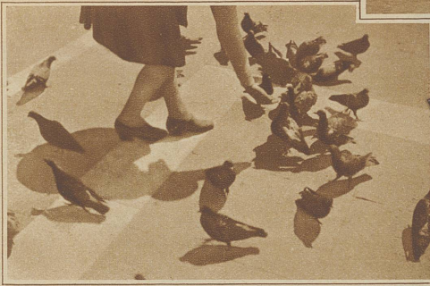
Auf dem Markusplatz. Ein altbekanntes Bild in neuer Perspektive

des Gepäcks zu bemächtigen suchen, wobei einer den andern an Lungenkraft überbietet. Ist jedoch dieser erste Sturm siegreich überstanden, dann beginnt jene wundervolle Gondelfahrt, den Canale grande entlang, die jeden, auch den, der die Stadt bereits kennt, immer wieder aufs Neue bezaubert und die erst am Markusplatz ihr Ende erreicht.