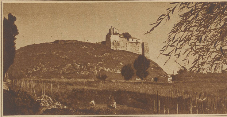
Der Galgenberg von Salerno, wo Rinaldini-Duca gehängt wurde

In Ponte Remito veranstaltet er einmal einen großen Schmaus, zu dem er sämtliche Armen und Waisen des Ortes lädt. Angelo zeigt sich besonders ritterlich gegen das weibliche Geschlecht — ganz im Gegensatz zu Rinaldo bei Vulpius. Einer seiner Historiker sagt: «Seine Handlungen waren immer ehrenhaft, er liebte die Ehre und den unbefleckten Ruf der Frauen, ganz gleich, ob sie reich oder arm waren.» Gegen das ihn verfolgende Militär, die Bergschützen und Feldgendarmen zeigt er sich heldenhaft tapfer und listig, aber auch großmütig. Die Erschießung eines Verräters nimmt er sich so zu Herzen, daß er vierzig Tage in die Einsamkeit geht und seine Bande führerlos zurückläßt. «Es ist kein Fall bekannt, in dem Angelo duldete, daß bewußt und außerhalb des legitimen Kriegszustandes, in dem er sich den Truppen gegenüber fühlte, ein Mensch getötet wurde.» Wie sehr sich Angelo als berufener, wenn auch nicht bestellter Diener der Gerechtigkeit empfand, geht daraus hervor, daß er immer wieder auf Verbrecher und gemeine Briganten Jagd machte und sie gebunden dem nächsten Gericht zur Bestrafung zuführen ließ.