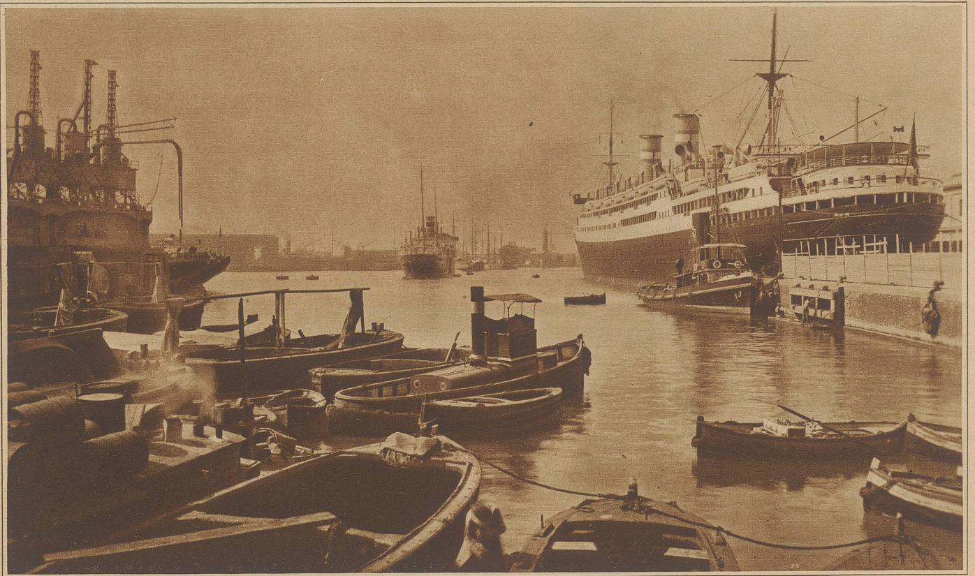
Im Hafen von Genua