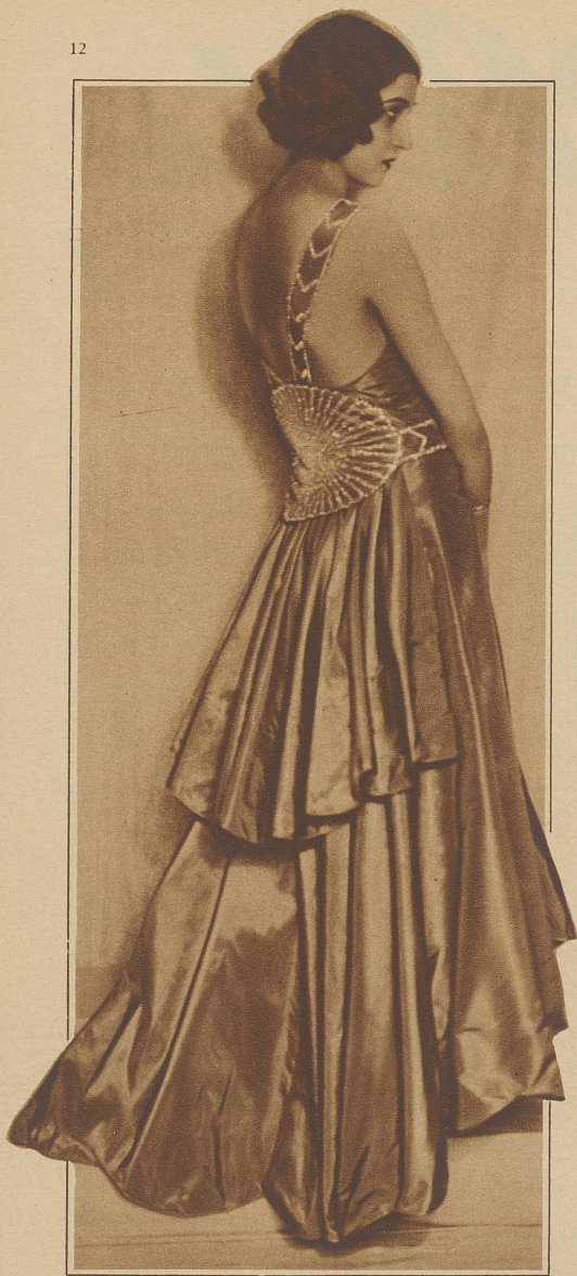
Die kommende Mode für den Ballsaal: entblößter Rücken und faltenreiches, schleppendes Kleid

neuen Kleidentwürfen ungefähr in jener Zeit wieder einzusetzen, da einst italienische Prinzessinnen den Fehler begingen, ihren kleidlichen Geschmack an den Hof Frankreichs zu importieren und damit den Grundstein zu legen zu einer weltumspannenden französischen Modeindustrie. Auf diesem Fundament und nach Vorbildern der Antike soll die italienische Mode erstehen. Schon spukt in einzelnen Köpfen die Vorstellung von