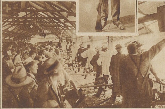
Blick in den Pistolenstand während des interkant. Matches, der von St. Gallen mit 496,383 Punkten vor Waadt, Solothurn, Basel-Land, Bern, Aargau, Zürich etc. gewonnen wurde

Der Gedenkbrunnen, den die Engelberger letzten Sonntag «dem Sänger des Tales» geweiht haben. Dr. Ed. Korrodi hält die Denkmalsrede