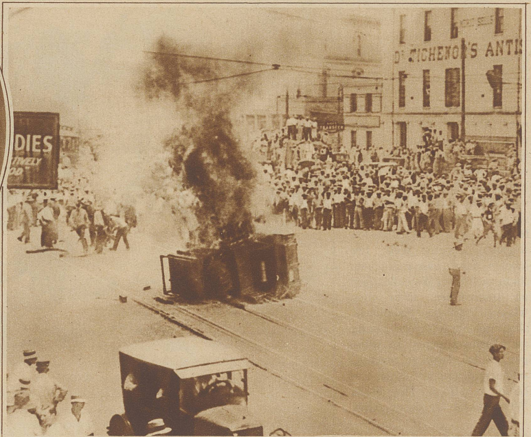
Blutige Ausschreitungen in New Orleans. In der an der Mündung des Mississippi gelegenen Stadt New Orleans ist ein Generalstreik der Transportarbeiter ausgebrochen, in dessen Verlauf es zu blutigen Kämpfen zwischen der Polizei und den Streikenden kam. Sechs Personen wurden getötet. Das Bild zeigt, wie Streikende ein Postauto umgeworfen und in Brand gesteckt haben