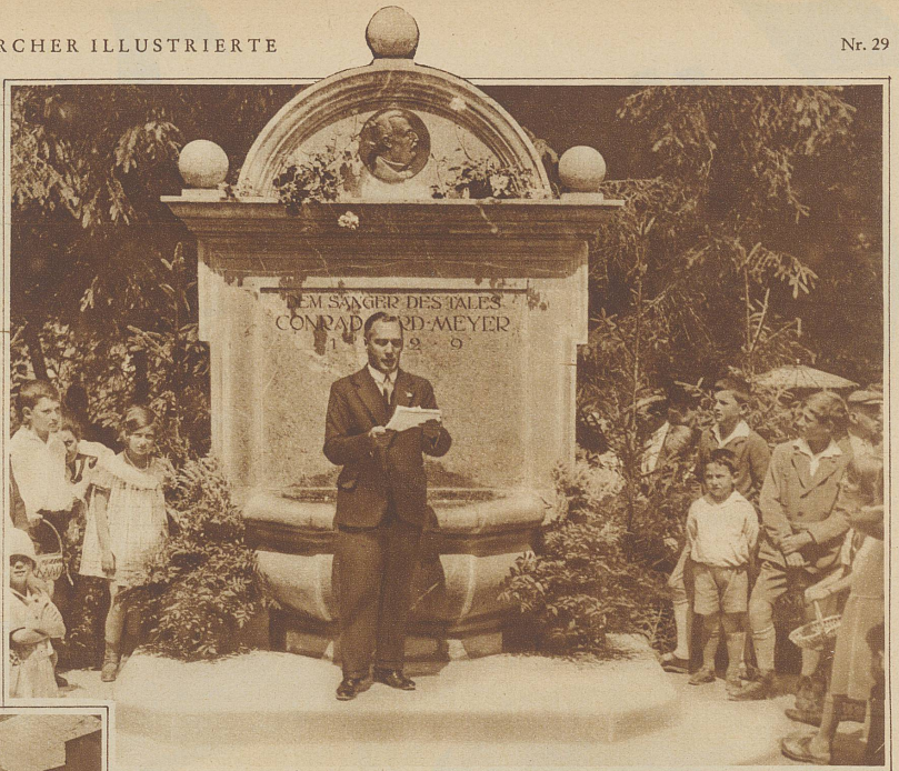
Engelberg ehrt Conrad Ferdinand Meyer