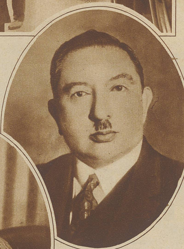
Der frühere afghanische Gesandte in Paris, der jetzt als Botschafter in Moskau lebt und wohl nicht zur Verantwortung gezogen werden kann

Die französische Polizei ist einem unglaublichen Skandal auf die Spur gekommen.