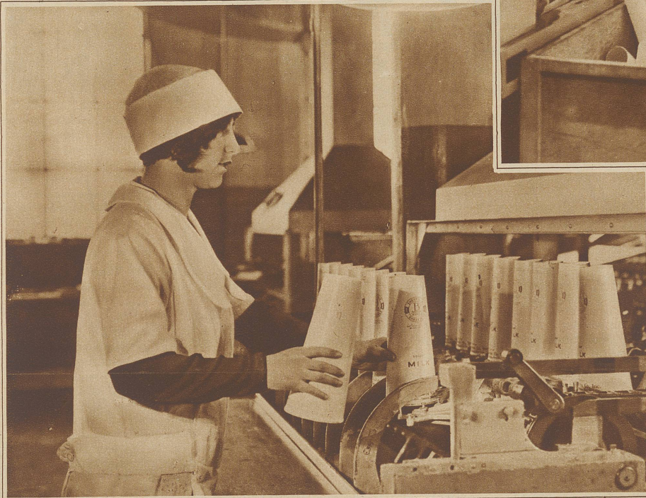
Sterilisierung durch ein Paraffinbad mit anschließender Luftkühlung

Einen unabherrschbaren Triumph hat namentlich das Papier zu verzeichnen. In New York sind jetzt durch eine Verordnung sämtliche gläserne Milchflaschen aus dem Verkehr gezogen und durch Flaschen aus Papier ersetzt worden. Man hat herausgefunden, daß die Glasflaschen zu teuer und die Papierflaschen nicht nur selbst hygienisch einwandfrei sind, sondern durch einen Metallverschluß auch jeder Einwirkung durch Bazillen oder Panscher ganz sicher entzogen sind. Man hat ausgerechnet, daß New York im Jahre rund 32 Milliarden solcher Papierflaschen verbrauchen wird.