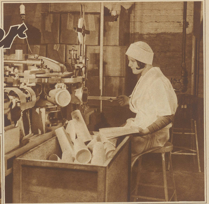
Ein Automat, der aus zugeschnittenem Papier die Flaschen formt

wachsartigen Substanz gleichmäßig überzogen, beim geschwinden Passieren eines luftgekühlten Raumes zu erhärten und doch elastisch und geschmeidig zu bleiben. Sie sind nun luftdicht, wasserfest und keimfrei gewor-