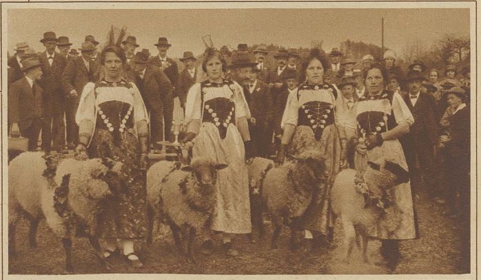
Kranzmädeli von Heimiswil