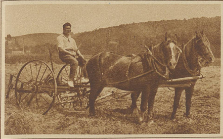
Röbu beim Heuen