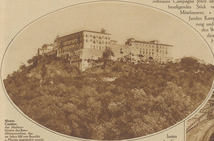
Monte Cassino, das Mutterkloster des Benediktinerordens, das im Jahre 529 von Benedikt v. Nursia gegründet wurde

nichtet. Seine Glanzepoche erlebte Monte Cassino unter dem Abt Desiderius, dem spätern Papst Viktor III. (1058 bis 1087). Unter Mithilfe des Herzogs Robert Guiscard und der byzantinischen Kaiser Michael und Alexius baute er eine herrliche Basilika mit drei Absiden, die ein Erdbeben im 14. Jahrhundert zerstörte. Monte Cassino erlebte den Bau der im Renaissancestil gehaltenen und prächtig mit florentinischem Marmor ausgekleideten dreischiffigen Basilika, die Papst Benedikt XIII. 1727 einweihte. Deren Krypta erhält seit 1900 durch die Beuroner Klosterkunstschule reiche Mosaik- und Skulpturarbeiten im Geiste des Begründers dieser Schule, Pater Desiderius Lenz, der, einst Professor der Bildhauerkunst an der Nürnberger Kunstgewerbeschule, aber auch Architekt und Maler, 1876 das Ordenskleid des Benediktiners nahm. * Den sehr bedeutenden Besitz Monte Cassinos beraubten 1799 die Franzosen, die Neapolitaner und seit 1860 die Piemontesen, die es acht Jahre später als Nationaldenkmal erklärten. * Das riesig ausgedehnte festungsartige Klostergebäude enthält ein drei große Säle umfassendes historisch äußerst wertvolles Archiv, das Mabilion «das bedeutendste von Italien» nannte, zwei an Hand-