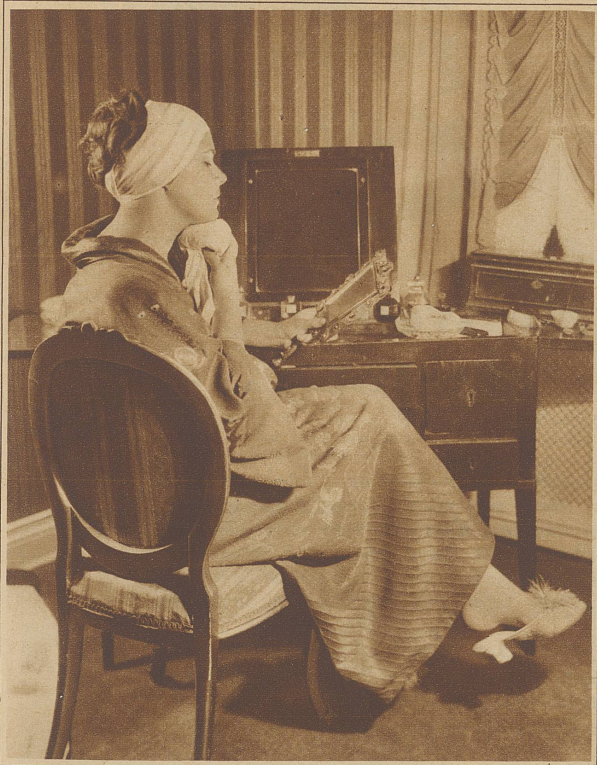
Schönheitspflege: das Gesicht wird mit Mandelöl eingerieben und mit einem in ein Handtuch gehülltes Stück Eis abgerieben und dann abgetrocknet

Und schließlich die zwei Augenblicke: ein Mal täglich bewußt «Lächeln» (vom Lächeln war kürzlich hier die Rede), und einmal herzlich laut lachen. – Wetten, daß dann... Elastizität noch besteht, wenn Schönheit vergeht? gt.