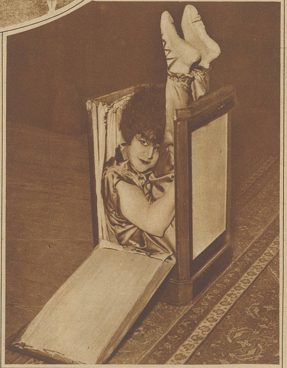
Diese Pariser Tänzerin hat ihre eigene Methode, sich «elastisch» zu halten: täglich vor dem Frühstück eine Viertelstunde Kastengymnastik

Gelegenheit. / Die dritte Viertelstunde: Schlaf am Tage. Nach dem Geschirrwaschen, nach besonders anstrengender Arbeit, wenn die Kinder das zweite Mal in der Schule, der Mann aus dem Haus. / Die vierte Viertelstunde: lesen. Wenn die «Zeitung», dann mit Ausschluß von Heiratsgesuchen, Unglücksfällen und Verbrechen. Oder ein gutes Buch. Noch besser ein «schweres», bei