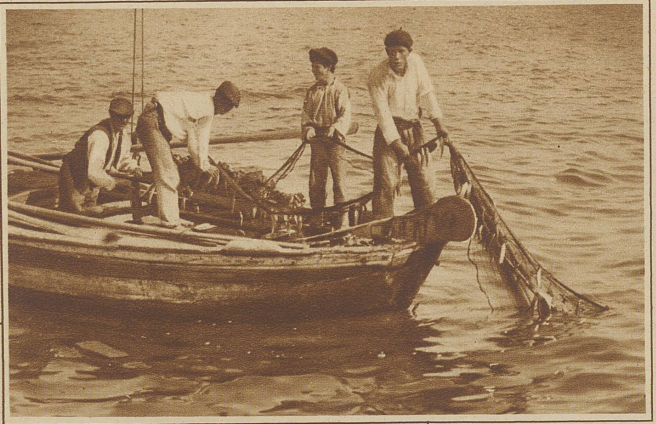
Sardellenfischer holen das Netz ein

auf; noch feiner und sorgfältiger müssen die aufgerollten Filets gemacht werden, in deren Mitte eine Olive gerollt wird, oder die in Oel