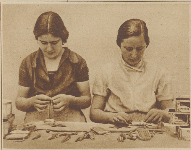
Arbeiterinnen bei der Herstellung der Konserven

herzustellen, der nachher auf dem Tisch des Feinschmeckers erscheint, sind gründlich geschulte Arbeitskräfte, eine «zarte Hand», notwendig. Darum sind auch ausschließlich Frauen bei der Weiter-