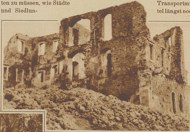
DURAZZO. Der ehemalige Palast des Prinzen von Wied, des früheren Herrschers von Albanien

Auf lendenlahmem Motorbootchen fuhr, neulich ich, von Montenegro kommend, über den Skutarisee gen Albanien, überreichlich versehen mit Informationen und Ratschlägen, das sagenhafte Land betreffend, unter denen jene, stets zwei geladene Revolver im Gürtel zu tragen, sowie Kotilonorden in ungezählten Mengen anzulegen, noch die mildesten waren. In der Tat, es herrschen seltsame Vorstellungen in Europa über diese «Italienische Kolonie», Vorstellungen, deren Realisierung vom klassischen Rom ebensoweit entfernt ist