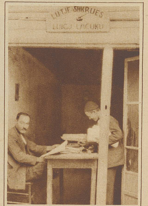
Da die wenigsten Leute schreiben können, ist der öffentliche Schreiber in Skutari stets gut beschäftigt

wie von den Produkten jenes wohlfeilen Journalismus, der mit dem Beinamen oben erwähnten kleinen Schießeisens am treffendsten charakterisiert ist. Allerdings tut man gut, einstweilen noch in diesem Staate viele Begriffe westeuropäischer Anschauung hintanzusetzen, aber muß deswegen durchaus alles den Anschein des Lächerlichen tragen? Was uns heute noch in Albanien komisch anmutet, ist doch lediglich ein Uebergangsstadium, wie es schließlich früher oder später jedes Land einmal absolvieren mußte; eine, zugegeben, hier besonders merkwürdige Mischung ehrwürdiger Ueberlieferungen mit den Errungenschaften unseres Jahrhunderts plus kraß zutage tretender Barbarei, die jedoch mehr und mehr im Abnehmen begriffen ist, wie beispielsweise das Aufknüpfen von Räubern auf offenem Markt, die Blutrache und jene mannig-