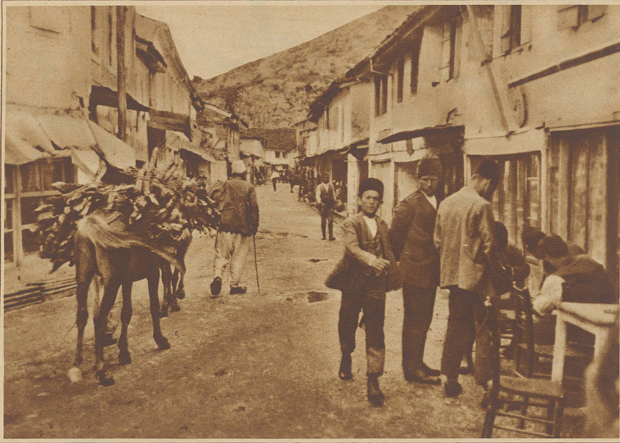
Die Hauptstraße in Korça (Mittelalbanien)

sicht Reminiscenzen auffrischen an jene Zeiten des alten Europa, da das gelbe Metall noch in unseren Taschen klirrte, ehe es sich in diese letzte Ecke des Erdteils verkümmerte. Zwanzigmarkstücke, englische Pfunde, schweizerisches, französisches, belgisches, österreichisches, griechisches, türkisches, kurz, alles was an Goldgeld in den letzten sechzig Jahren kursierte, gilt hier als offizielles Zahlungsmittel neben den Silbermünzen dieser Länder, deren jede, ob Franken, ob Dinar oder Krone, die Summe von 37 Rappen repräsentiert. Vierundfünfzig solcher Silberstücke bedeuten einen Napoleon d'or oder zwanzig Vorkriegs-Goldfranken. Daneben