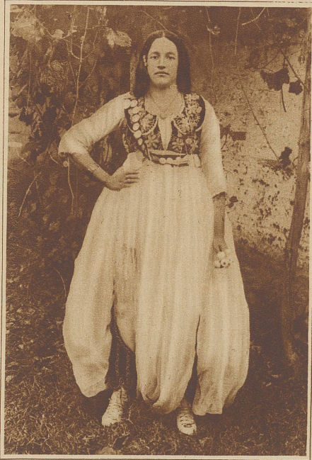
Albanische Zigeunerin im Sonntagsstaat