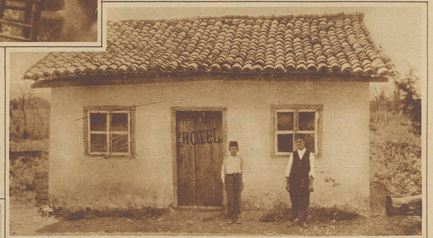
Ein «Hotel» im Innern des Landes

Trotz mannigfacher Strapazen während meiner Reisen durch das Königreich Albanien überzog