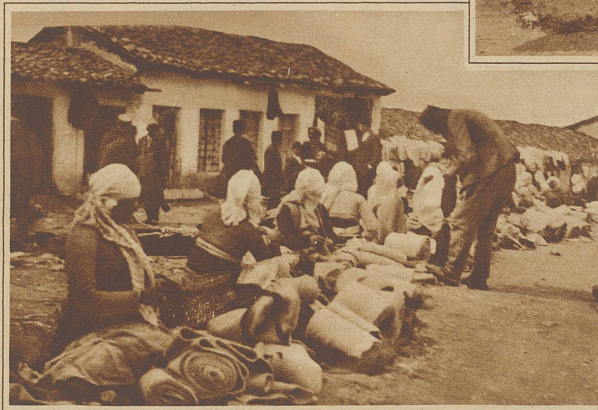
Bäuerinnen verkaufen auf dem Markt ihre handgewebenen Stoffe

zeugt deutlich genug von der Tatsache, daß Albanien in Ordnung geht. Ueberall im Lande macht sich Italiens großer Einfluß bemerkbar, ein Einfluß,