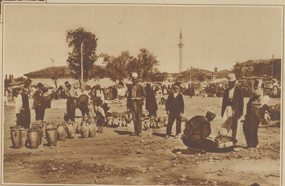
Nebenstehend rechts: Auf dem Topfmarkt in Tirana

vom gleichen Wunsche besetzten Einheimischen, zusammen ein Auto und gelangt so sicher und ohne allzu großen Verzug an Ort und Stelle, wo der Fahrpreis in — Gold entrichtet wird. Denn Gold ist immer noch neben Silber das hervorragendste Zahlungsmittel in Albanien. Man kann in dieser Hin-