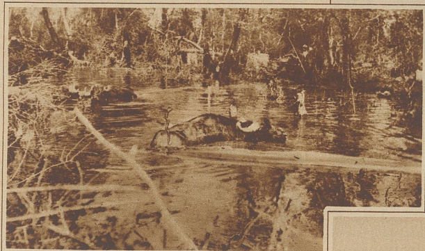
Büffelstiere in den Sümpfen von Mamuras

wie von den Produkten jenes wohlfeilen Journalismus, der mit dem Beinamen oben erwähnten kleinen Schießeisens am treffendsten charakterisiert ist. Allerdings tut man gut, einstweilen noch in diesem Staate viele Begriffe westeuropäischer Anschauung hintanzusetzen, aber muß deswegen durchaus alles den Anschein des Lächerlichen tragen? Was uns heute noch in Albanien komisch anmutet, ist doch lediglich ein Uebergangsstadium, wie es schließlich früher oder später jedes Land einmal absolvieren mußte; eine, zugegeben, hier besonders merkwürdige Mischung ehrwürdiger Ueberlieferungen mit den Errungenschaften unseres Jahrhunderts plus kraß zutage tretender Barbarei, die jedoch mehr und mehr im Abnehmen begriffen ist, wie beispielsweise das Aufknüpfen von Räubern auf offenem Markt, die Blutrache und jene mannig-