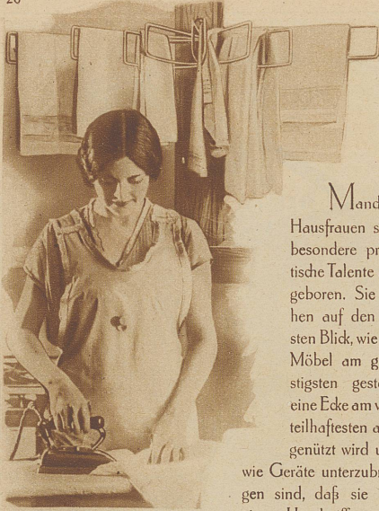
Ein Wäschetrockner, der außer Gebrauch nahezu keinen Platz beansprucht

Manchen Hausfrauen sind besondere praktische Talente angeboren. Sie sehen auf den ersten Blick, wie ein Möbel am günstigsten gestellt, eine Ecke am vorteilhaftesten ausgenutzt wird und