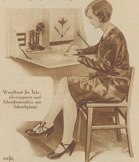
Wandbrett für Telefonapparat und Schreibutensilien mit Schreibplatte

Am meisten aneinander hängen anscheinend die Ehepaare in Kanada: hier kommt auf 161 Ehen eine Scheidung. Auch die Enländer lieben es nicht sonderlich, zu zerreißen, was Gott zusammengefügt hat: nur in einem Falle von 96 hat im letzten Jahr in England eine Ehescheidung stattgefunden. Dann aber kommt ein geradezu meilenweiter Abstand. Hinter England marschiert Schweden mit 55:1. Deutschland und Frankreich sind schon wieder ein Stückchen frivoler: in Deutschland kommt auf 24, in Frankreich auf 21 Eheschließungen eine Scheidung. Wieso die Schweiz, die im allgemeinen den Ruf geradezu auffälliger Biederkeit ge-