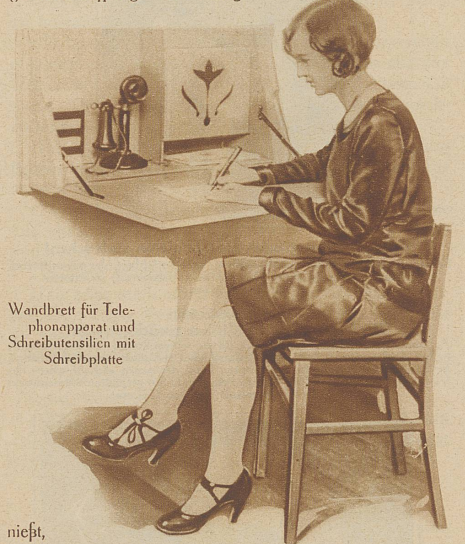
Wandbrett für Telefonapparat und Schreibutensilien mit Schreibplatte

Am meisten aneinander hängen anscheinend die Ehepaare in Kanada: hier kommt auf 161 Ehen eine Scheidung. Auch die Enländer lieben es nicht sonderlich, zu zerreißen, was Gott zusammengefügt hat: nur in einem Falle von 96 hat im letzten Jahr in England eine Ehescheidung stattgefunden. Dann aber kommt ein geradezu meilenweiter Abstand. Hinter England marschiert Schweden mit 35:1. Deutschland und Frankreich sind schon wieder ein Stückchen frivoler: in Deutschland kommt auf 24, in Frankreich auf 21 Eheschließungen eine Scheidung. Wieso die Schweiz, die im allgemeinen den Ruf geradezu auffälliger Biederkeit ge-