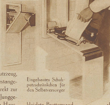
Eingebautes Schuhputzdränkchen für den Selbstversorger

kleidete Bretterwand abschließt, oder aber die Tür als Rückenwand benützt und einen vor allem oben gut abschließenden Vorhang darüber zieht.