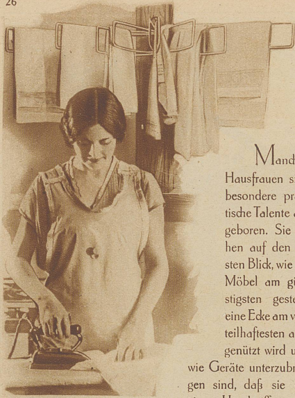
Ein Wäschetrockner, der außer Gebrauch nahezu keinen Platz beansprucht

Manchen Hausfrauen sind besondere praktische Talente angeboren. Sie sehen auf den ersten Blick, wie ein Möbel am günstigsten gestellt, eine Ecke am vorteilhaftesten ausgenutzt wird und