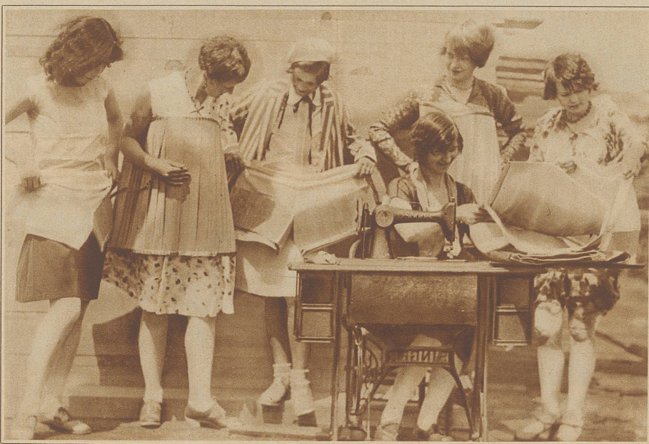
Vor Torschluss der diesjährigen Badesaison macht eine sensationelle Erfindung von sich reden: Anzüge aus Fichtenholz-Spänen. Unser Bild zeigt eine Anprobe soeben auf der Nähmaschine fertiggestellter Anzüge

Aber Halt! Die Amerikaner sind Dilettanten gegen die Sowjetrussen. In Leningrad wurden in den ersten fünf Monaten des letzten Jahres im ganzen 9681 Ehen geschlossen. Von diesen Ehen gingen 7255 wieder auseinander. Das ist ein Rekord, um den alle Boxer, Läufer, Kanalschwimmer und Sportheroen die Sowjetunion beneiden können!