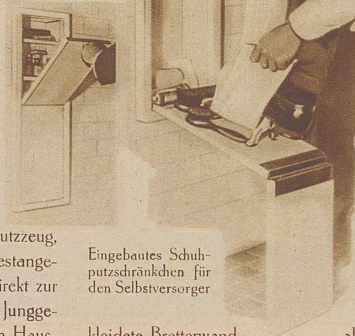
Eingebautes Schuhputzdränkchen für den Selbstversorger

kleidete Bretterwand als Tür als Rückenwand benützt und einen vor allem oben gut abschließenden Vorhang darüber zieht.