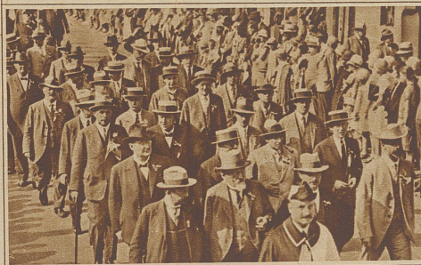
Die Basler Regierung im Festzug