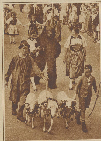
Der Bernerhirt. Dem Mutzen im Hintergrund ist schon unbeschreiblich heiß, seine hübsche Begleiterin macht ihm nun auch noch zu schaffen