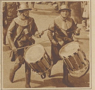
Trommler im Panzerhemd