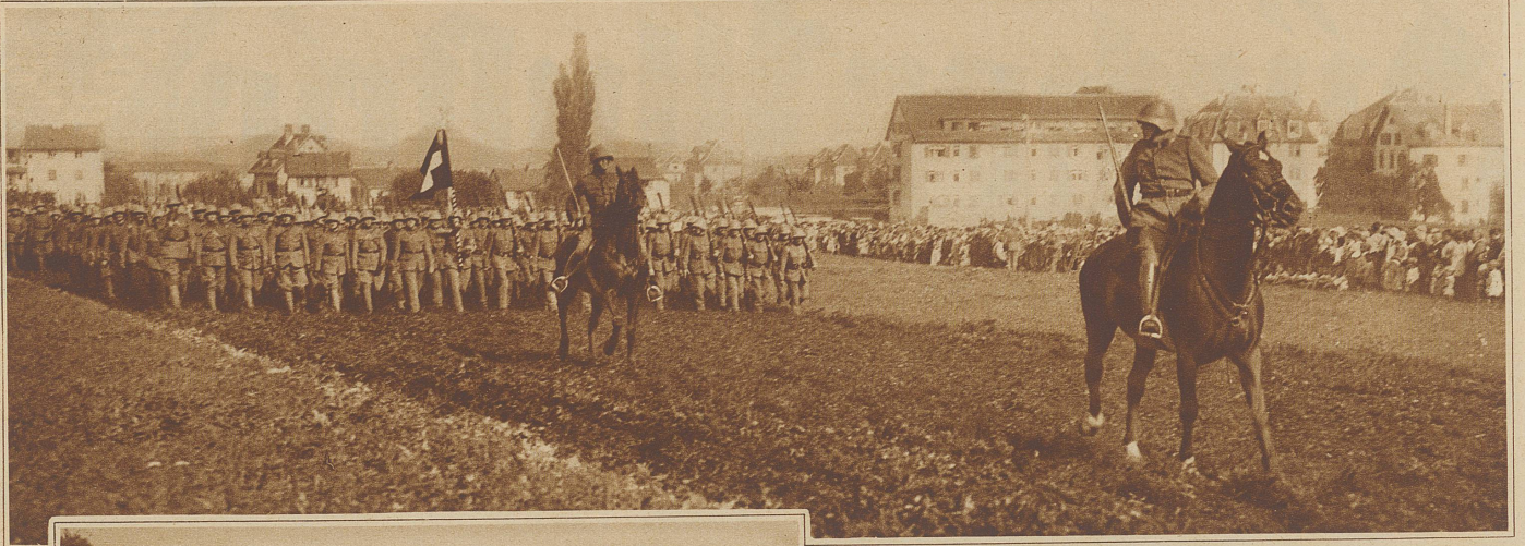
Defilee vor Oberstdivisionär Wille in Zürich