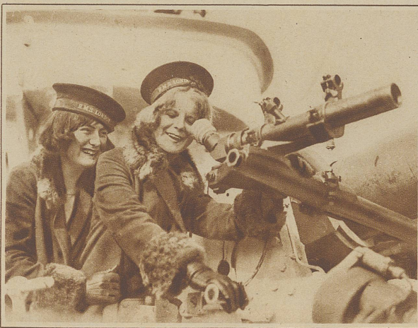
Am Geschützfernrohr. Diese hübschen Besucherinnen betrachten es als Spiel, dem Nachdenklichen scheint's Ernst

Die Engländer erlauben nicht nur ihren eigenen Leuten ihre Kriegsschiffe zu besichtigen, wie sie das kürzlich in Chatham eine Woche lang taten, sie erlauben das auch andern Nationen, wenn sich gerade schickt, und man gerade gut miteinander steht oder stehen will. So kam auch ich einmal in Venedig zum Besichtigen. Ganz von ungefähr wurde die Gelegenheit mir in der Stadt bekannt und ich reiste mit vielen andern Leuten auf einem Dampferchen hinaus vor den Lido an die Breitseite des Kreuzers. Alles stieg an Bord, und jeder ging wohin er wollte. Führung gab's nicht. Nach kurzer Zeit war die ganze Gesellschaft in Löchern und Gängen verschwunden. So gewaltig war der Kerl, daß man da still für sich stundenlang herumspazieren konnte, wobei man dann ab und zu einer andern Landratte begegnete, wie daheim einem vereinzelt Sonntagsspaziergänger. Es gab Panzertürme mit dicken Platten und mit einer Fülle von Seh- und Meß-Instrumenten, gewaltige baumlange Kanonenrohre, andere kleinere, längsseitig schießende, die durch Schlitze schauten und tief versteckt hinter bauchigen Panzerplatten von erstauilicher Dicke standen. Ueberall war's