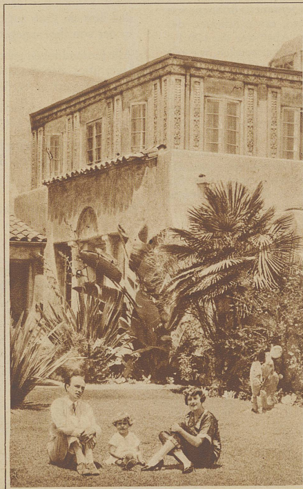
Conrad Veidt mit Familie im Garten seiner Villa in Beverly Hills bei Hollywood

(Aus dem demnächst erscheinenden Buch des Verfassers: «Hollywood, die Stadt der Illusionen».)