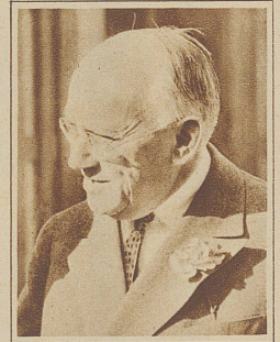
«Onkel Carl», der bekannte Filmagnat Carl Laemmle, in Hollywood. Laemmle stammt aus Württemberg.

Conrad Veidt erzählte mir: «Als ich in Hollywood ankam, fand am gleichen Abend gerade eine «Opening night» statt. Sie müssen unbedingt mit mir hinkommen, sagte John Barrymore zu mir und ließ mir keine Ruhe, bis ich zusagte. Aber am Abend war mein Gepäck noch nicht eingetroffen, und ich mußte mir einen Smoking leihen, dessen Hosen mir viel zu kurz waren. Nun stellen Sie sich vor, wie mir zumute war, als ich, todmüde und abgespannt, von der endlosen Reise mit Barrymore in meinen viel zu kurzen Hosen aus dem Auto stieg. Der Lautsprecher brüllte: Hier kommt John Barrymore mit dem deutschen Schauspieler Conrad «Wieth». Ein geradezu ohrenbetäubendes Pfeifen und Gröhlen der versammelten Volksmenge war die liebenswürdige Antwort. Wie konnte ich Neuling wissen, daß dies ein begeisterter Willkommen sein sollte? Ich nahm das Pfeifen und Johlen für eine feindselige Demonstration gegen den «deutschen Schauspieler Wieth» auf und lief, ja rannte in gestrecktem Galopp in meinen kurzen Hosen, um mich im Innern des Theaters in Sicherheit zu bringen.»